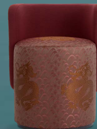
◀▲ BOLL design Simone Micheli