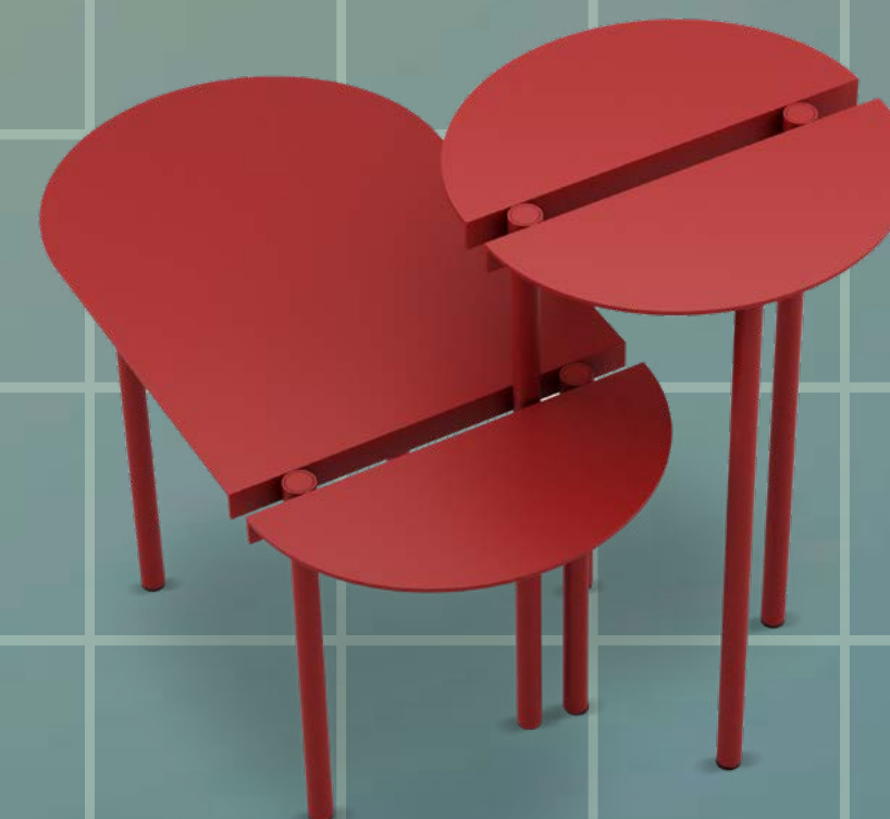
▲ ORIT design Max Voytenko