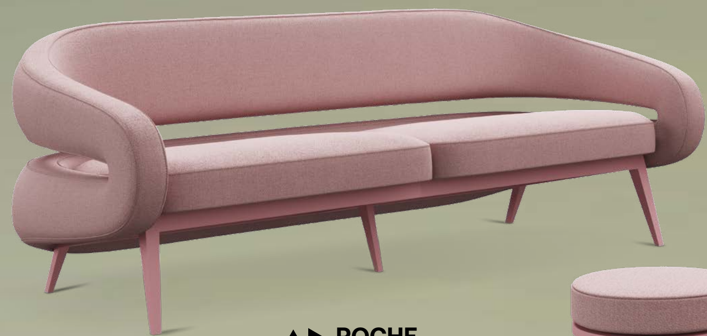
▲► ROCHE design Daria Zinovatnaya