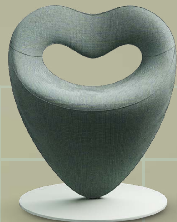
◀ LOV design Simone Micheli