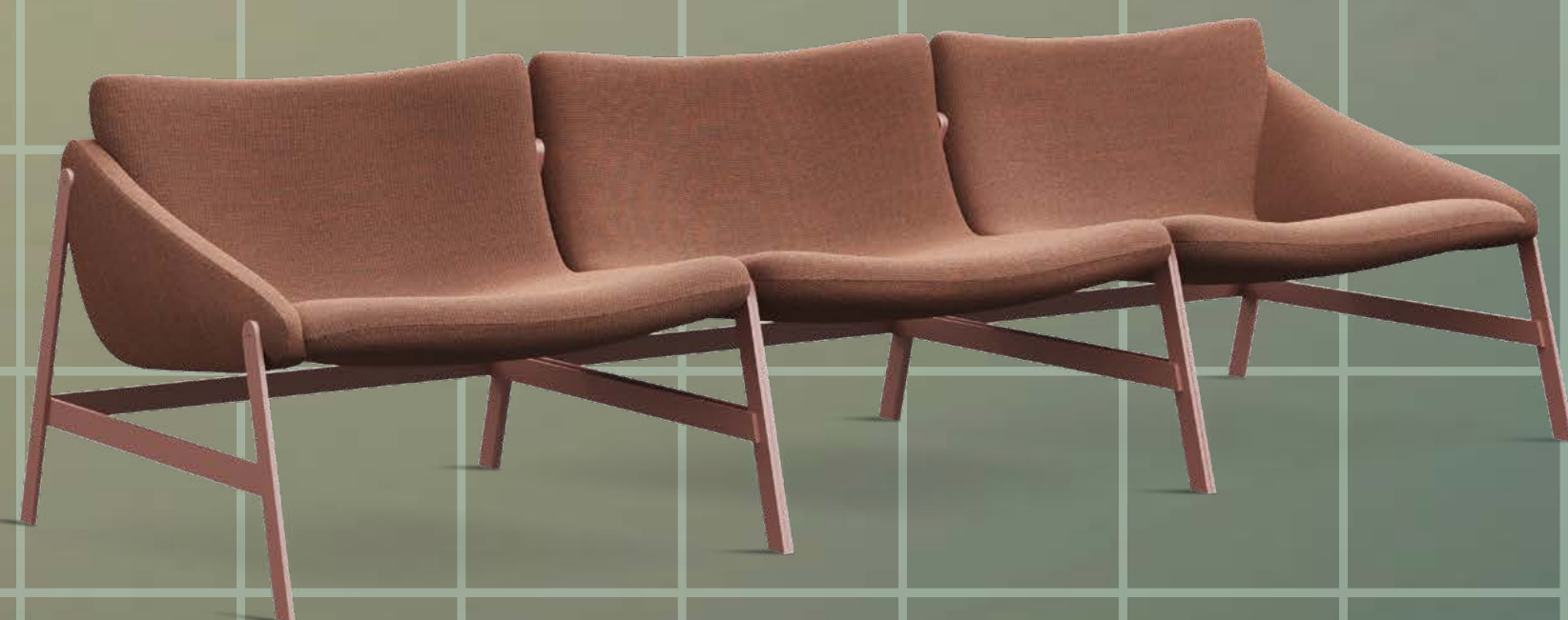
◀ HAMMOCK design Debonademeo