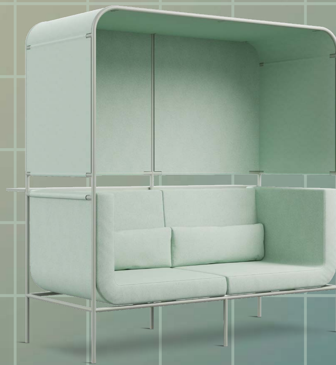
◀▲► PASSEPARTOUT design Debonademeo