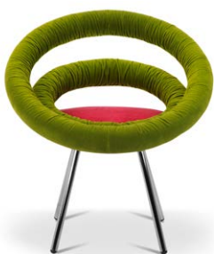
Circle gambe con rivestimento velluto non elastico