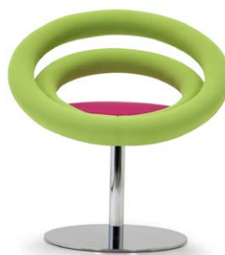
Circle B 01 rivestimento bielastico