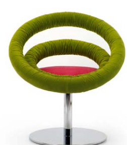
Circle B 01 rivestimento velluto non elastico