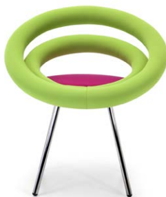
Circle gambe con rivestimento bielastico

I velluti e le finte pelli vestono il prodotto con morbidezza con piccole pence nella parti più stondate, che diventano caratteristica naturale di questa versione