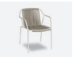
pag 98 EASY POLTRONCINA / DINING ARMCHAIR cod 773/BCO02 ▮61 h 62 h77.5 h146 ▮47.5 ▮x6