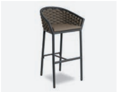
pag 52 DUB SGABELLO / BARSTOOL cod 655/AT04 R57 h52 h98 h177 P45