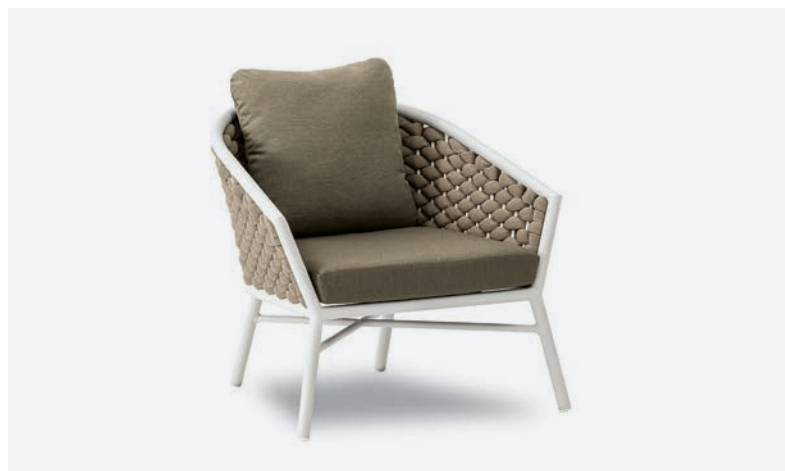
POLTRONA DUB COD 500/BCO02