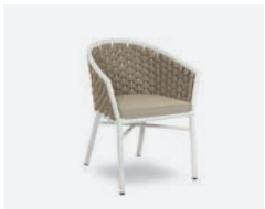
pag 48 DUB POLTRONCINA / DINING ARMCHAIR cod 718/BCO02 R60 h60 h77 h47 h48 x5