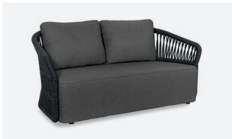
DIVANO METHOD COD 566/AT34