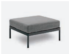
pag 92 VILLA BASE SINGOLA / SINGLE BASE cod 530/AT P75 P75 P40