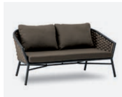
pag 36 DUB DIVANO / 2 SEATER SOFA cod 501/AT04 R161 h81 h74 h41