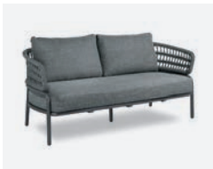
pag 30 BLED DIVANO / 2 SEATER SOFA cod 528/AT R181 h83 h77 h43