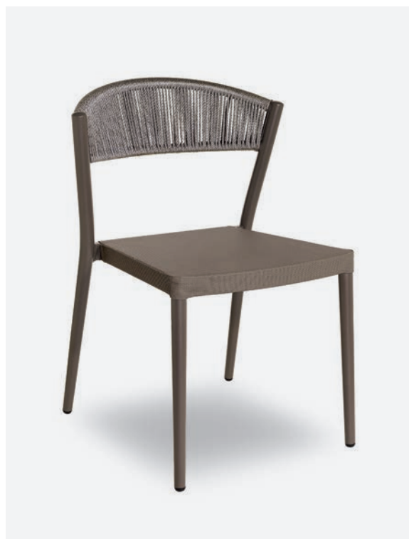
SEDIA ARIEL COD 794/TAU