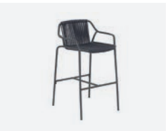
pag 100 EASY SGABELLO / BARSTOOL cod 662/AT34 ▮60 h 55 h105 h176 ▮42.5