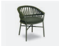
pag 16 METHOD POLTRONCINA / DINING ARMCHAIR cod 715/VER13 R62 h58 h79 h48 h49 x5