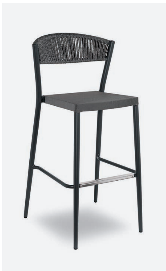
SGABELLO DUKE COD 658/AT

Barstool with polyester powder coated aluminum frame. The back is lined with a hand-woven synthetic rope and the seat is made of PVC fabric.