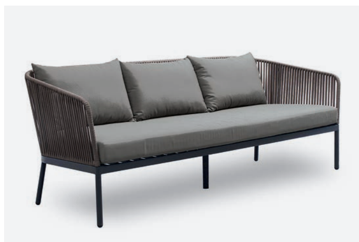
DIVANO 3 POSTI BERGEN COD 544/AT