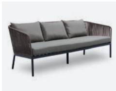
pag 70 BERGEN DIVANO 3 POSTI / 3 SEATER SOFA cod 544/AT R218 h85 h80 h41