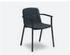
pag 104 ALESSIA POLTRONCINA / DINING ARMCHAIR cod 774/AT35 ▮57 h 57 h78 h145 ▮45 ▮x8