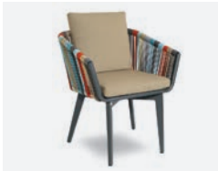
pag 62 IRIDE FODERA CUSCINO / CUSHION COVER cod 1721/03