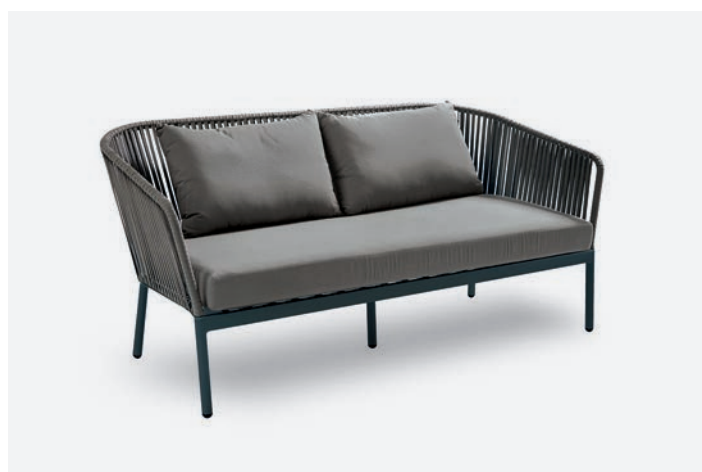
DIVANO 2 POSTI BERGEN COD 543/AT