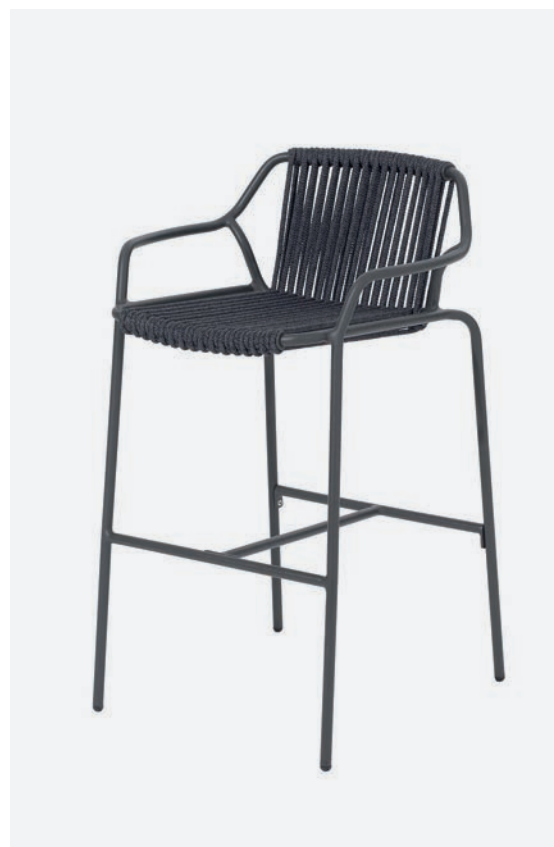
SGABELLO EASY COD662/AT34