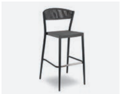
pag 120 DUKE SGABELLO / BARSTOOL cod 658/AT ▮54 h 58 h113 h80 ▮41 ▮x6