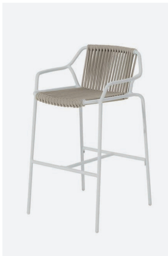
SGABELLO EASY COD662/BCO02

Barstool polyester powder-coated aluminum frame diameter 19mm and thickness 3mm; seat and back covered with 10mm synthetic rope.