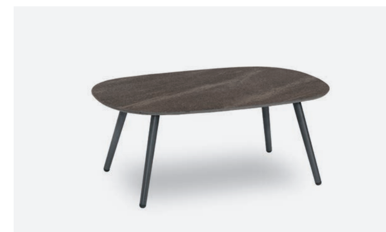
TAVOLINO DOVER COD 523/AT-GAL