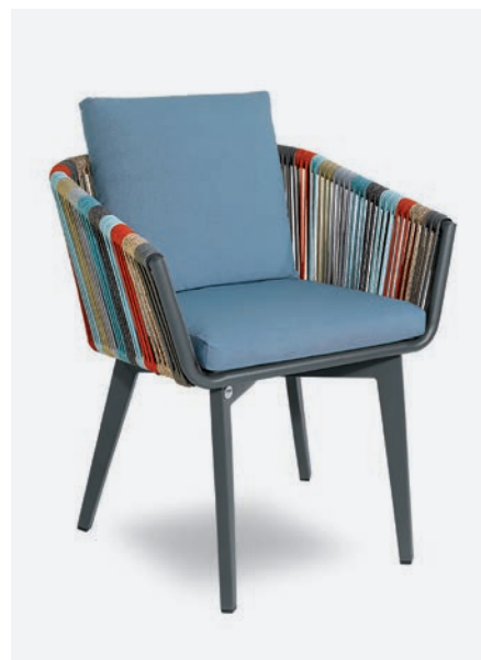
FODERA OPZIONALE COL. AZZURRO COD 1721/33