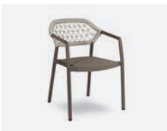
pag 114 GAUDI POLTRONCINA / DINING ARMCHAIR cod 731/TAU ▮56 h 58 h80 h145 ▮51 ▮x8