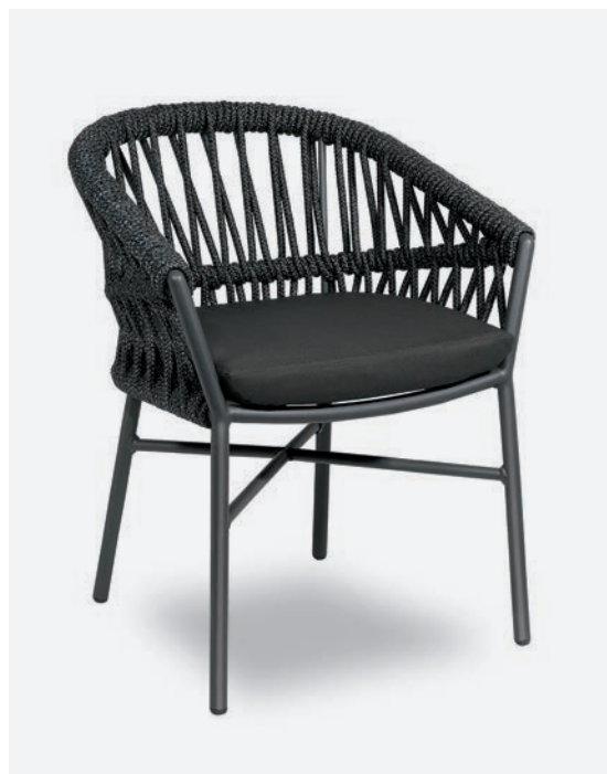
POLTRONCINA METHOD COD 715/AT34