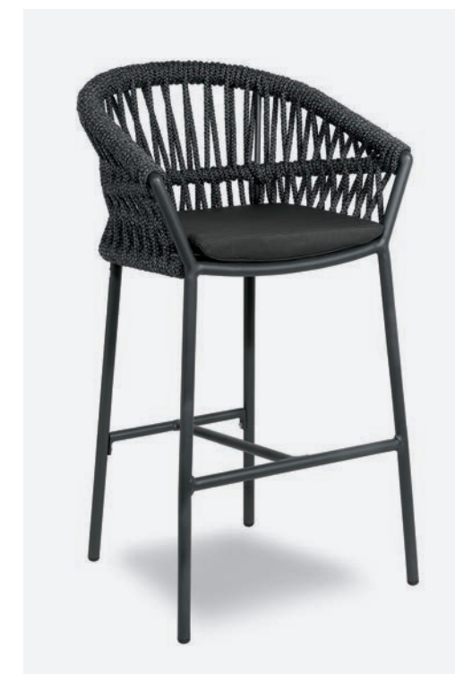
SGABELLO METHOD COD 660/AT34