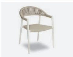
pag 116 PRAGA POLTRONCINA / DINING ARMCHAIR cod 793/BCO ▮58 h 56 h77 h144,5 ▮50 ▮x7