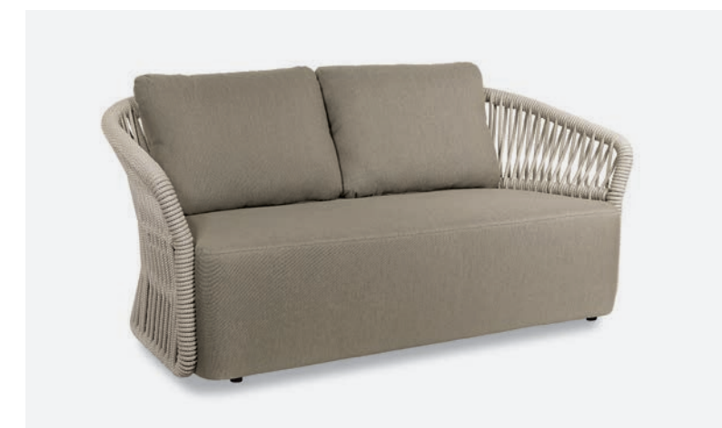
DIVANO METHOD COD 566/BCO02