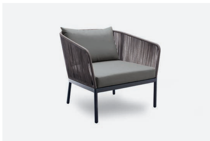
POLTRONA BERGEN COD 542/AT