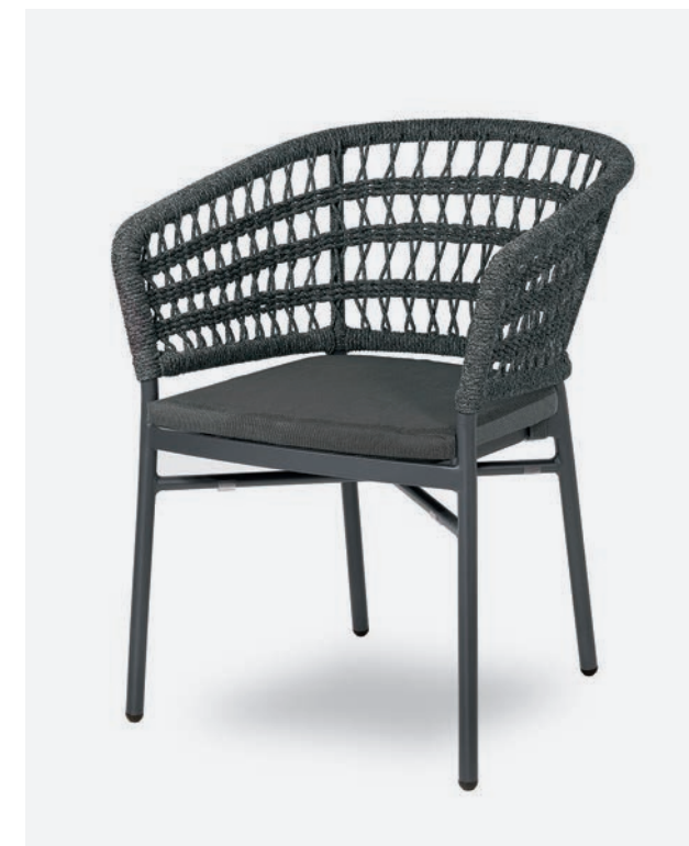
POLTRONCINA BLED COD 722/AT

Dining armchair with polyester powder coated aluminum frame. Back is lined with a hand-woven synthetic rope. The cushion has a removable PVC fabric cover and quick dry padding.