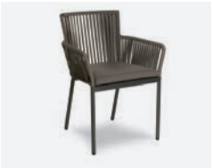
pag 72 MEGAN POLTRONCINA / DINING ARMCHAIR cod 728/AT R59 h59,5 h80 h47,5 P47 X6