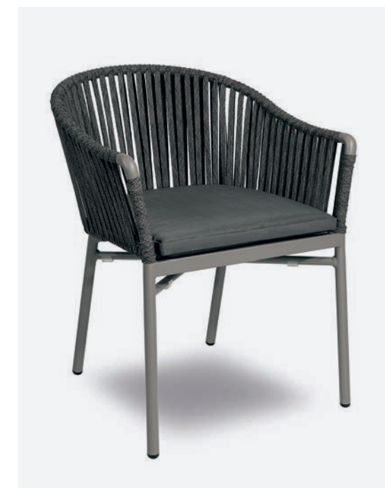
POLTRONCINA KARIN COD 726/GR