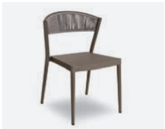
pag 118 ARIEL SEDIA / CHAIR cod 794/TAU ▮53,5 h 54 h77 h144,5 ▮44 ▮x9