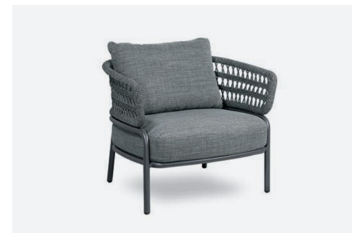
POLTRONA BLED COD 527/AT