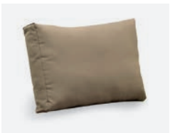
pag 94 VILLA CUSCINO SCHIENALE / BACKREST CUSHION cod 533/TAU ▮73 ▮45