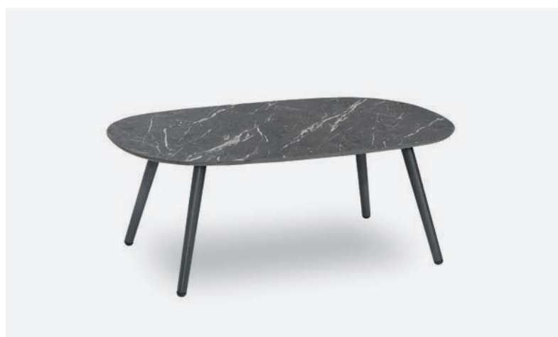
TAVOLINO DOVER COD 523/AT-MAGR