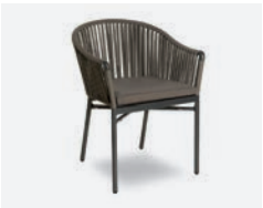
pag 74 KARIN POLTRONCINA / DINING ARMCHAIR cod 726/AT R60 h58 h78 h48 P47 X6