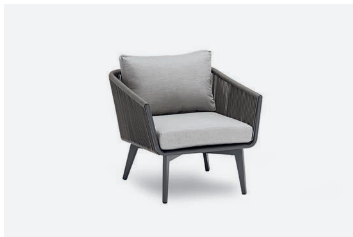
POLTRONA DIVA COD 505