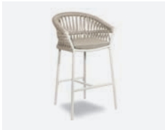
pag 20 METHOD SGABELLO / BARSTOOL cod 660/BCO02 R60 h55 h105 h76 h42.5