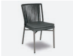
pag 78 NICOLE SEDIA / CHAIR cod 727/GR R45,5 h57 h82 h47 P44 X8