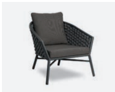
pag 40 DUB POLTRONA / LOUNGE ARMCHAIR cod 500/AT35 R80 h81 h74 h41