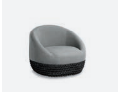
pag 86 TONGA POLTRONA / LOUNGE ARMCHAIR cod 560/AT R91 h91 h73 h41