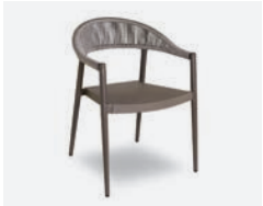
pag 116 PRAGA POLTRONCINA / DINING ARMCHAIR cod 793/TAU ▮58 h 56 h77 h144,5 ▮50 ▮x7