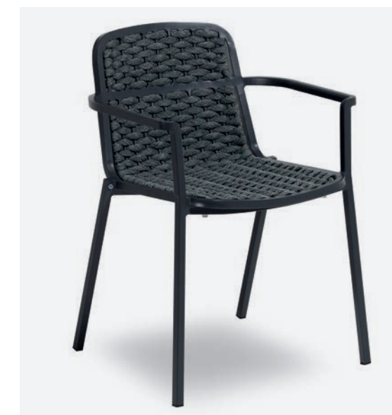
POLTRONCINA ALESSIA COD 774/AT35