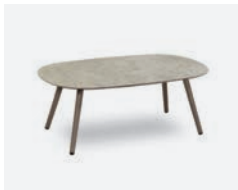
pag 28 DOVER TAVOLINO / COFFEE TABLE cod 523/TAU-EMP n95 n59 n36