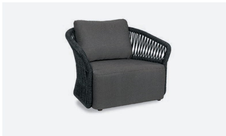
POLTRONA METHOD COD 565/AT34