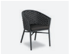
pag 50 DUB POLTRONCINA / DINING ARMCHAIR cod 718/AT35 R60 h60 h77 h47 h48 x5