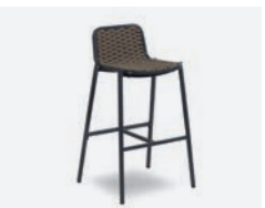
pag 106 ALEX SGABELLO / BARSTOOL cod 651/AT04 ▮55 h 48 h95 h176 ▮41