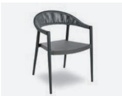
pag 116 PRAGA POLTRONCINA / DINING ARMCHAIR cod 793/AT ▮58 h 56 h77 h144,5 ▮50 ▮x7