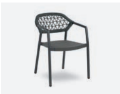
pag 114 GAUDI POLTRONCINA / DINING ARMCHAIR cod 731/AT ▮56 h 58 h80 h145 ▮51 ▮x8