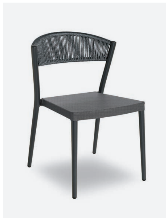
SEDIA ARIEL COD 794/AT