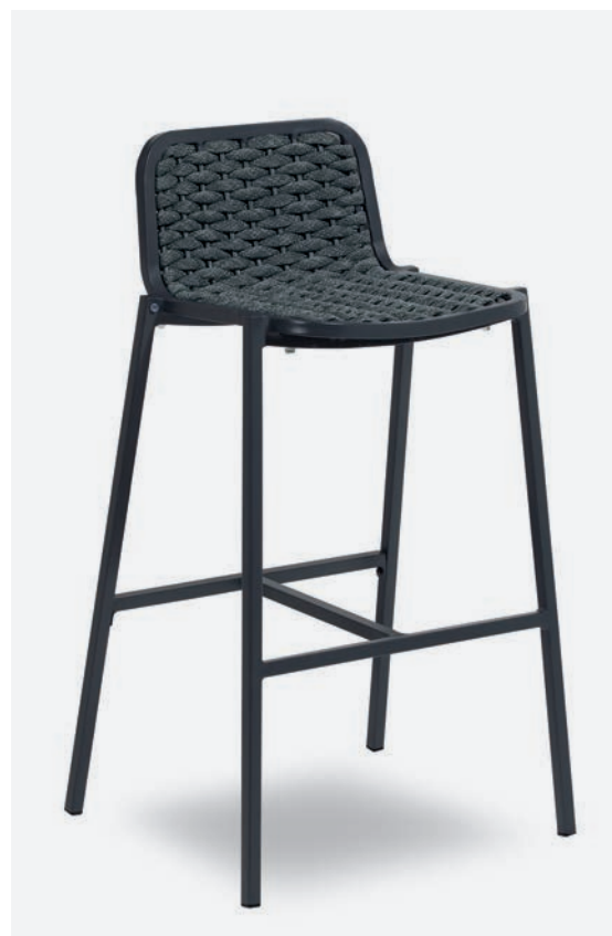
SGABELLO ALEX COD 651/AT35