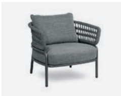
pag 30 BLED POLTRONA / LOUNGE ARMCHAIR cod 527/AT R92 h83 h76 h43