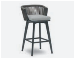
pag 64 DIVA SGABELLO / BARSTOOL cod 650 R57 h57,5 h98,5 h77 P40