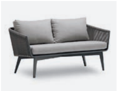
pag 58 DIVA DIVANO 2 POSTI / 2 SEATER SOFA cod 506 R138 h80 h70 h42