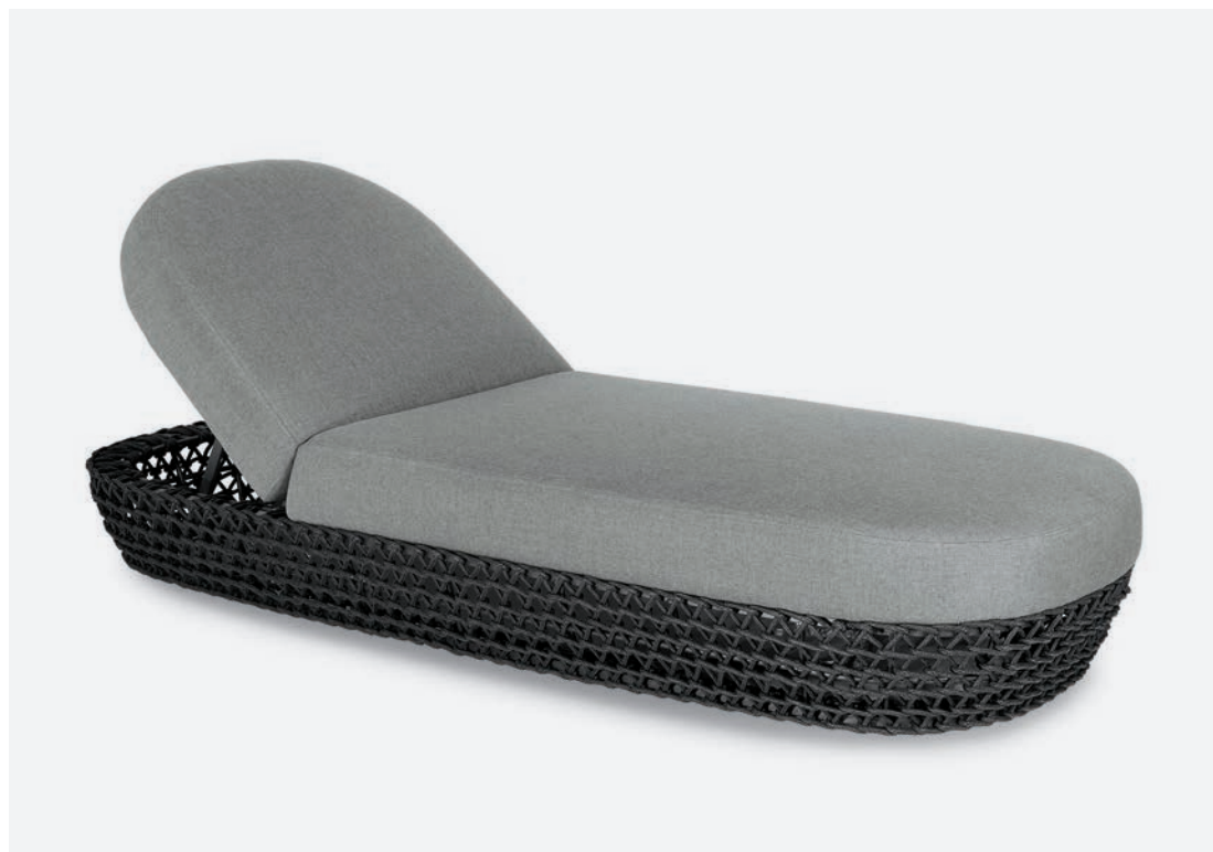
LETTINO TONGA COD 606/AT

Sunlounger with polyester powder coated aluminum structure lined with hand woven synthetic rope. Six position adjustable back. The integrated cushion is made waterproof by an outer layer of Sunbrella fabric under which a thermosealed plastic shell covers the padding completely.