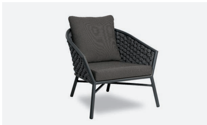
POLTRONA DUB COD 500/AT35