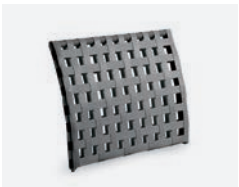
pag 92 VILLA SCHIENALE / BACKREST cod 532/AT ▮69 ▮11,5 ▮52