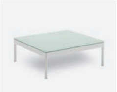
pag 94 BERGEN TAVOLINO / COFFEE TABLE cod 545/BCO ▮75 ▮75 ▮28