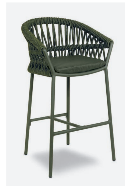
SGABELLO METHOD COD 660/VER13