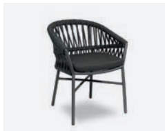
pag 18 METHOD POLTRONCINA / DINING ARMCHAIR cod 715/AT34 R62 h58 h79 h48 h49 x5