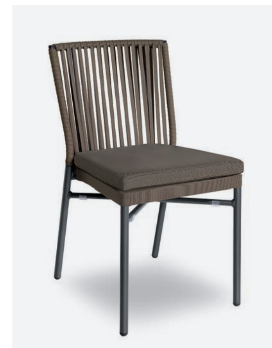
SEDIA NICOLE COD 727/AT