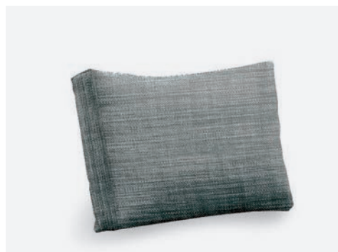
CUSCINO SCHIENALE VILLA COD 533/GR

I cuscini sono in tessuto 100% poliestere e sfoderabili. Il tavolino è in alluminio verniciato a polveri di poliestere con piano in vetro temperato.