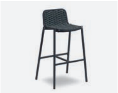
pag 106 ALEX SGABELLO / BARSTOOL cod 651/AT35 ▮55 h 48 h95 h176 ▮41