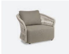
pag 14 METHOD POLTRONA / LOUNGE ARMCHAIR cod 565/BCO02 R103 h89.5 h74 h40