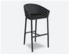
pag 52 DUB SGABELLO / BARSTOOL cod 655/AT35 R57 h52 h98 h177 P45