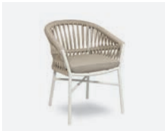
pag 18 METHOD POLTRONCINA / DINING ARMCHAIR cod 715/BCO02 R62 h58 h79 h48 h49 x5