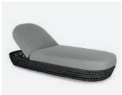
pag 88 TONGA LETTINO / SUNLOUNGER cod 606/AT P82 P205 P36