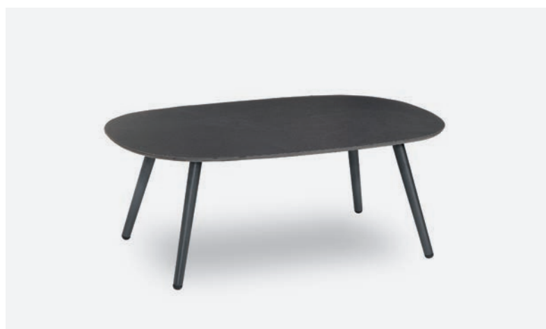
TAVOLINO DOVER COD 523/AT-ARDE