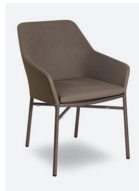
POLTRONCINA GISELLE COD 729/TAU