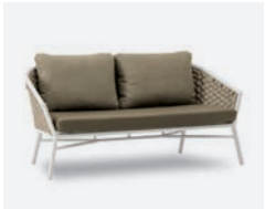
pag 44 DUB DIVANO / 2 SEATER SOFA cod 501/BCO02 R161 h81 h74 h41