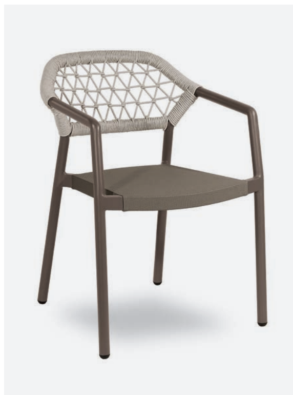
POLTRONCINA GAUDÌ COD 731/TAU

Dining armchair with polyester powder coated aluminum frame. The back is lined with a hand-woven synthetic rope and the seat is made of PVC fabric.