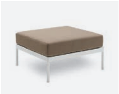
pag 94 VILLA BASE SINGOLA / SINGLE BASE cod 530/BCO ▮75 ▮75 ▮40