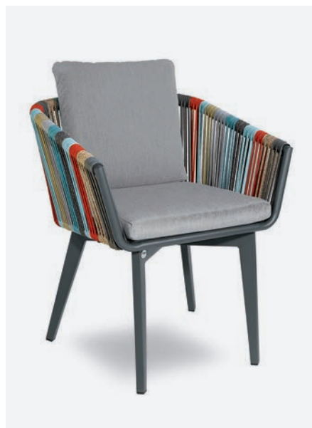
POLTRONCINA IRIDE COD 721