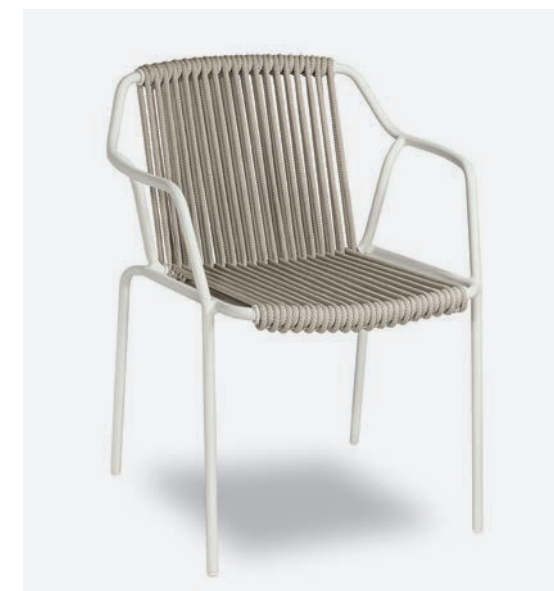
SEDIA EASY COD 773/BC002

Dining armchair polyester powder-coated aluminum frame diameter 19mm and thickness 3mm; seat and back covered with 10mm synthetic rope.