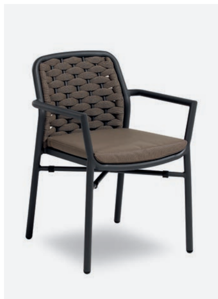
POLTRONCINA FLORA COD 717/AT04