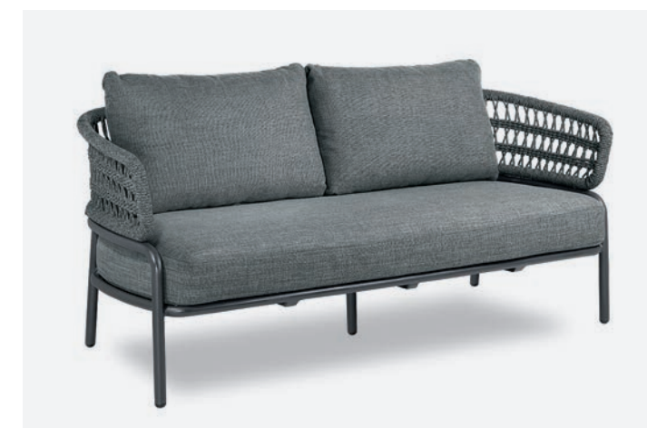
DIVANO BLED COD 528/AT