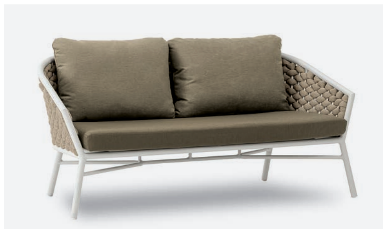
DIVANO DUB COD 501/BCO02