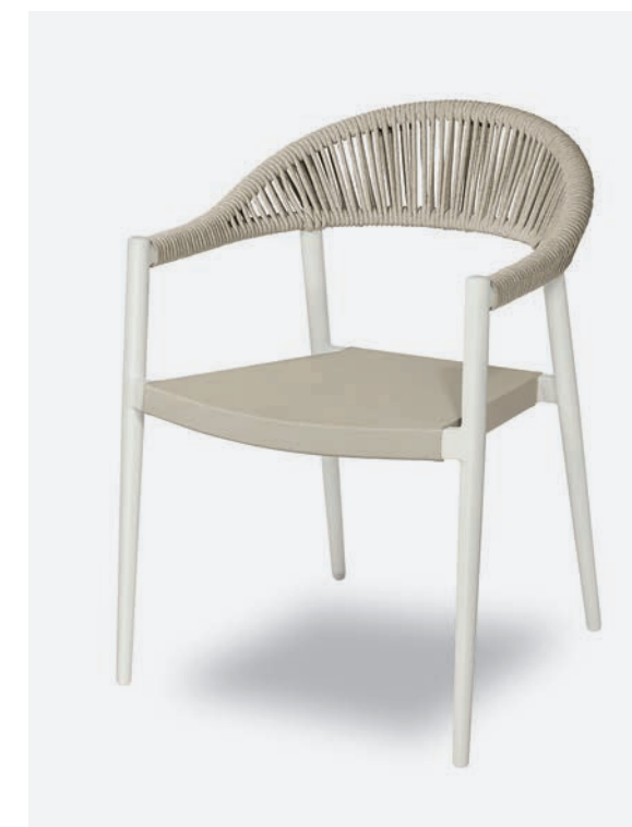
POLTRONCINA PRAGA COD 793/BCO

Dining armchair with polyester powder coated aluminum frame. Back is covered with a hand-woven synthetic rope and the seat is made of PVC fabric.