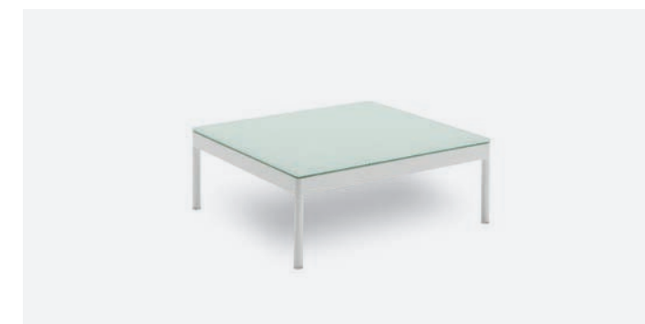
TAVOLINO BERGEN COD 545/BCO

Cushions have removable covers, 100% polyester fabric. The coffee table is in polyester powder coated aluminum with tempered glass top.