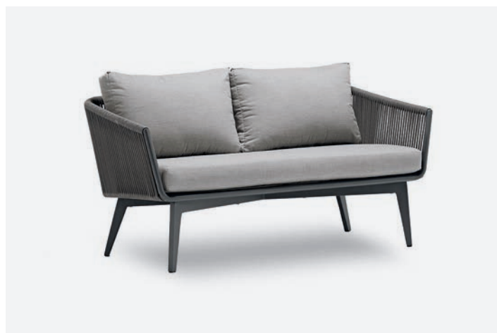
DIVANO 2 POSTI DIVA COD 506