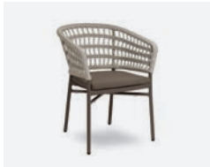
pag 32 BLED POLTRONCINA / DINING ARMCHAIR cod 722/TAU R63 h63 h81 h48 h45 x8