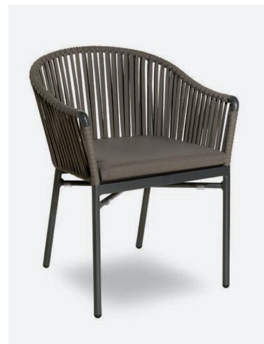
POLTRONCINA KARIN COD 726/AT