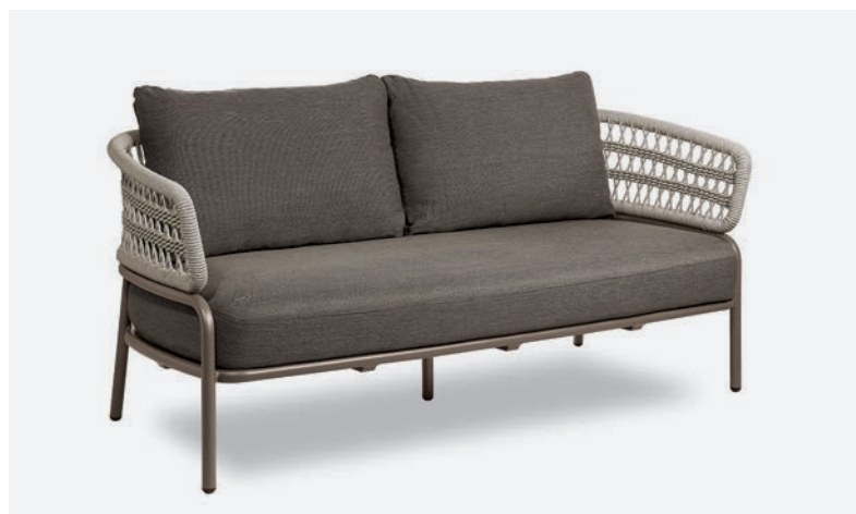
DIVANO BLED COD 528/TAU