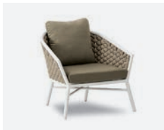
pag 44 DUB POLTRONA / LOUNGE ARMCHAIR cod 500/BCO02 R80 h81 h74 h41