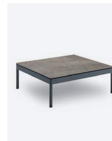
TAVOLINO BERGEN COD 547/AT-FOS