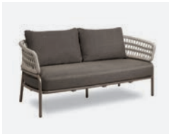
pag 28 BLED DIVANO / 2 SEATER SOFA cod 528/TAU R181 h83 h77 h43