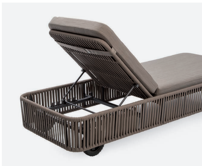
LETTINO BERGEN COD 604/AT

Lettino con struttura in alluminio verniciato a polveri di poliestere rivestita in corda sintetica piatta. Dotato di ruote e con schienale regolabile in sei posizioni. Cuscino in tessuto 100% poliestere, sfoderabile.