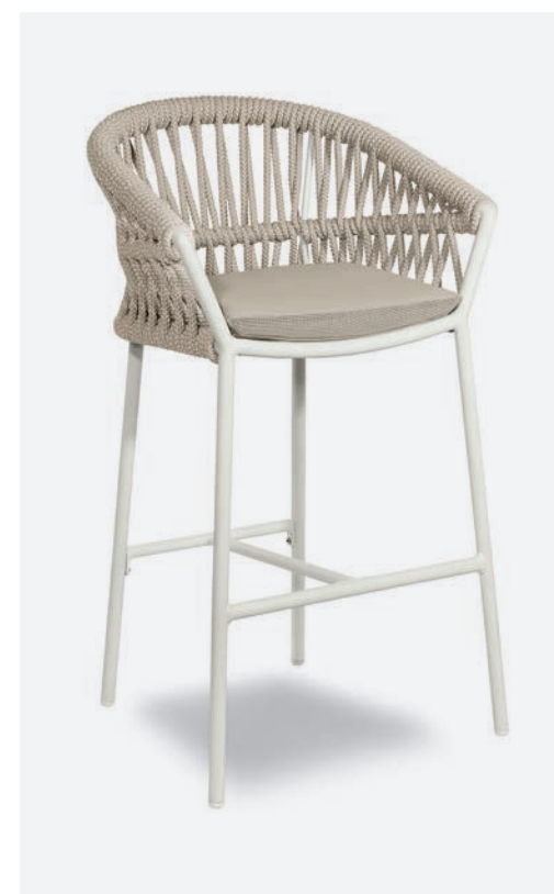
SGABELLO METHOD COD 660/BCO02

Barstool with polyester powder-coated aluminum frame, covered with hand-woven synthetic rope. The seat cushion is PVC fabric, with draining padding, removable cover.