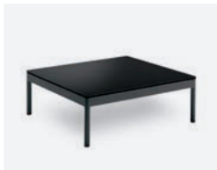
pag 70 BERGEN TAVOLINO / COFFEE TABLE cod 545/AT P75 P75 P28