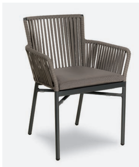
POLTRONCINA MEGAN COD 728/AT

Dining armchair with polyester powder coated aluminum frame. Back is covered with a hand-woven synthetic flat rope. The cushion has a removable PVC fabric cover and quick dry padding.