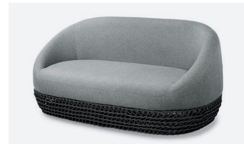
DIVANO TONGA COD 561/AT