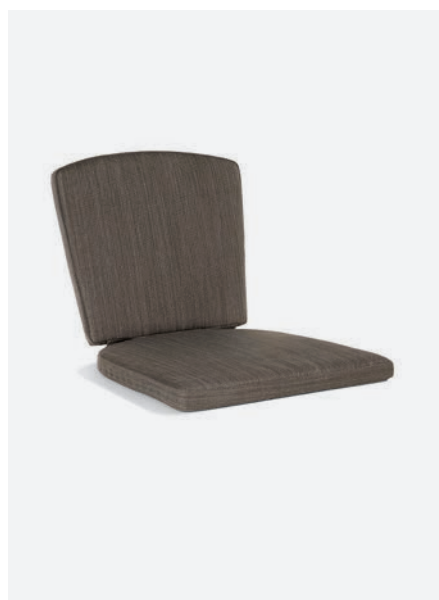
CUSCINO KARIN+MEGAN COD 1530/04