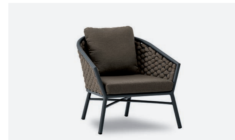
POLTRONA DUB COD 500/AT04