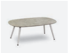
pag 44 DOVER TAVOLINO / COFFEE TABLE cod 523/BCO-EMP n95 n59 n36