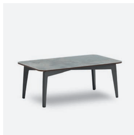
TAVOLINO DIVA COD 508