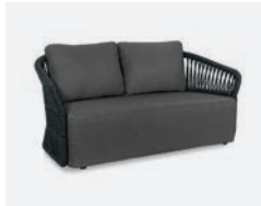
pag 10 METHOD DIVANO / 2 SEATER SOFA cod 566/AT34 R172 h89.5 h74 h40