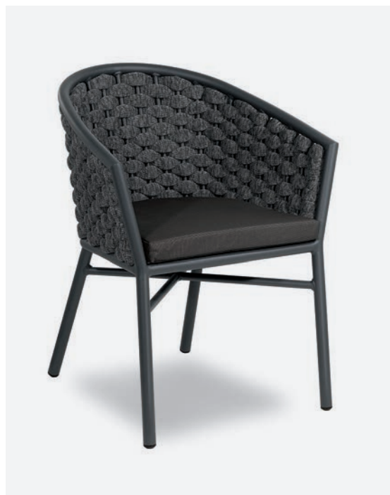
POLTRONCINA DUB COD 718/AT35