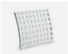
pag 94 VILLA SCHIENALE / BACKREST cod 532/BCO ▮69 ▮11,5 ▮52