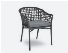
pag 124 KARIN NET POLTRONCINA / DINING ARMCHAIR cod 723/AT ▮61 h 58 h78 h147,5 ▮48 ▮x6