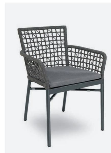
POLTRONCINA MEGAN NET COD 724/AT