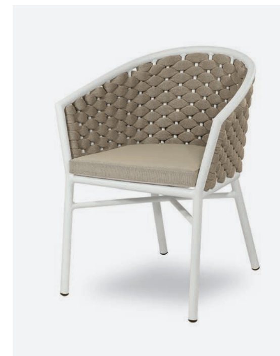
POLTRONCINA DUB COD 718/BCO02

Dining armchair with polyester powder coated aluminum frame. Back is covered with a hand-woven synthetic fabric tubular padded with rubber. The cushion has a removable PVC fabric cover and quick dry padding.