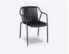
pag 98 EASY POLTRONCINA / DINING ARMCHAIR cod 773/AT34 ▮61 h 62 h77.5 h146 ▮47.5 ▮x6