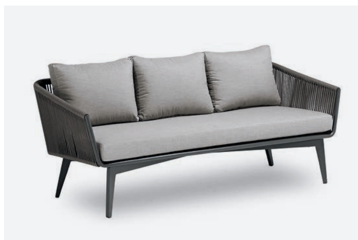
DIVANO 3 POSTI DIVA COD 507