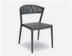
pag 118 ARIEL SEDIA / CHAIR cod 794/AT ▮53,5 h 54 h77 h144,5 ▮44 ▮x9