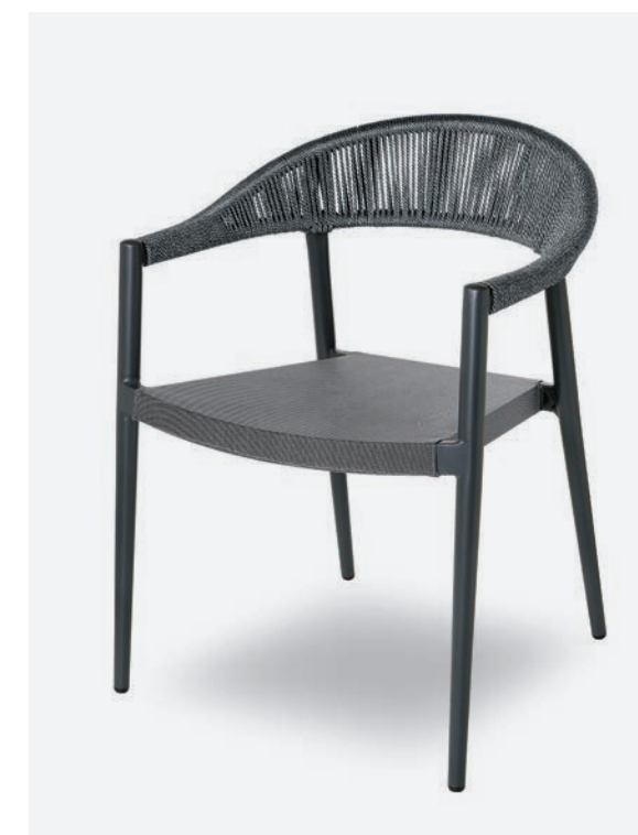
POLTRONCINA PRAGA COD 793/AT