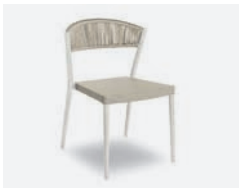
pag 118 ARIEL SEDIA / CHAIR cod 794/BCO ▮53,5 h 54 h77 h144,5 ▮44 ▮x9