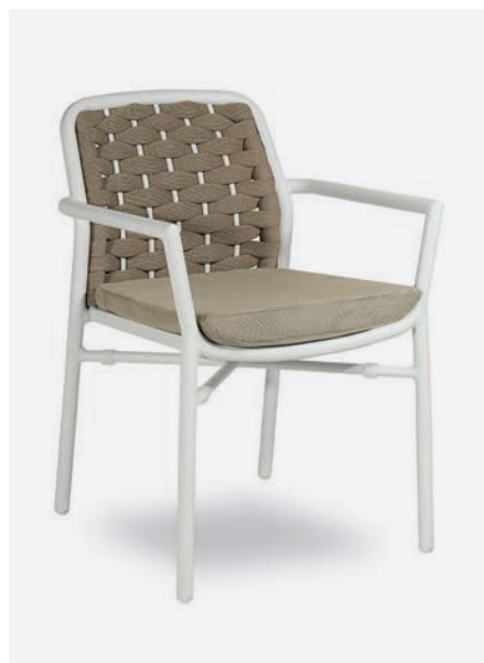
POLTRONCINA FLORA COD 717/BCO02