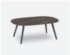
pag 36 DOVER TAVOLINO / COFFEE TABLE cod 523/AT-GAL n95 n59 n36