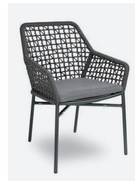
POLTRONCINA GISELLE NET COD 725/AT