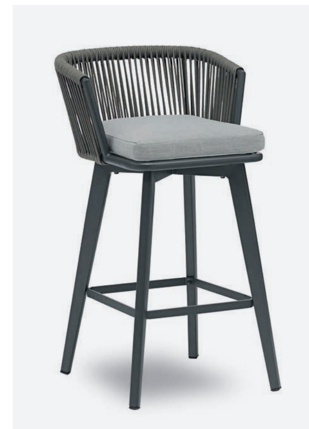
SGABELLO DIVA COD 650

Barstool with polyester powder coated aluminum frame. Back is covered with a hand-woven synthetic rope. The cushion has a removable 100% polyester fabric cover.