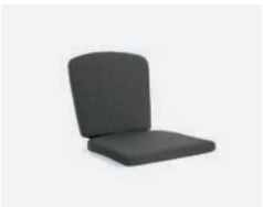
pag 76 KARIN - MEGAN CUSCINO / CUSHION cod 1530/98