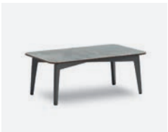
pag 58 DIVA TAVOLINO / COFFEE TABLE cod 508 P93 P58 P36