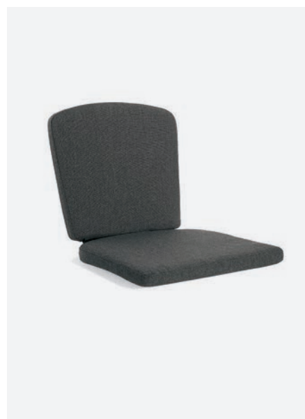
CUSCINO KARIN+MEGAN COD 1530/98