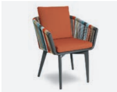
pag 62 IRIDE FODERA CUSCINO / CUSHION COVER cod 1721/07