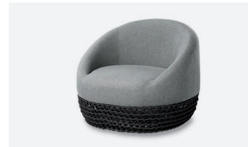
POLTRONA TONGA COD 560/AT