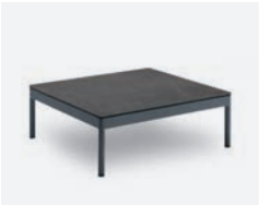
pag 70 BERGEN TAVOLINO / COFFEE TABLE cod 547/AT-ARDE P75 P75 P28