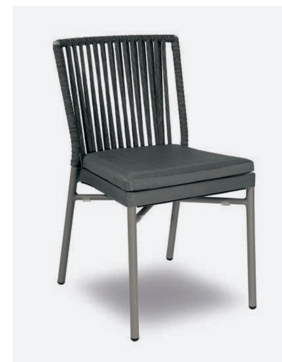
SEDIA NICOLE COD 727/GR