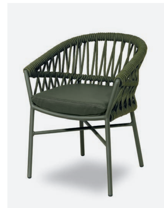
POLTRONCINA METHOD COD 715/VER13

Dining armchair with polyester powder-coated aluminum frame, covered with hand-woven synthetic rope. Seat cushion is PVC fabric, with draining padding, removable cover.