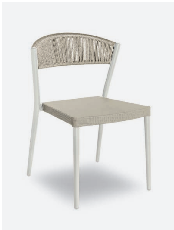
SEDIA ARIEL COD 794/BCO