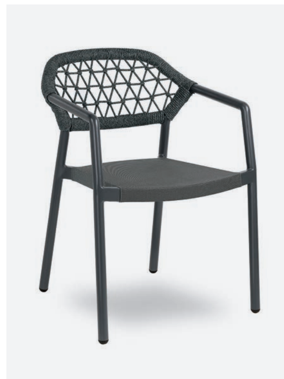
POLTRONCINA GAUDÌ COD 731/AT