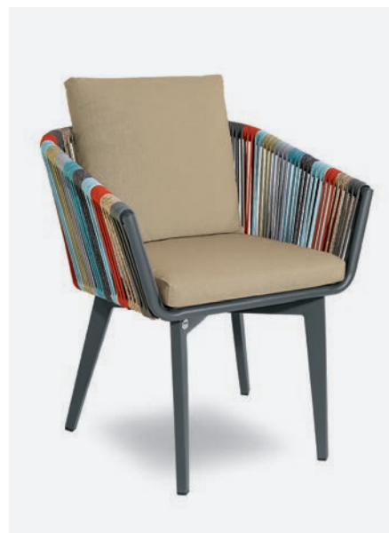
FODERA OPZIONALE COL. SABBIA COD 1721/03