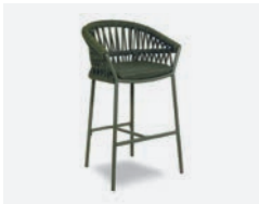
pag 22 METHOD SGABELLO / BARSTOOL cod 660/VER13 R60 h55 h105 h76 h42.5