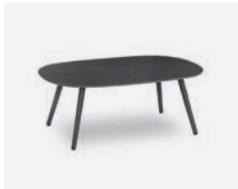
pag 30 DOVER TAVOLINO / COFFEE TABLE cod 523/AT-ARDE n95 n59 n36