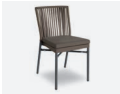
pag 78 NICOLE SEDIA / CHAIR cod 727/AT R45,5 h57 h82 h47 P44 X8