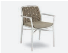
pag 110 FLORA POLTRONCINA / DINING ARMCHAIR cod 717/BCO02 ▮55,5 h 56 h78 h145 ▮45 ▮x8