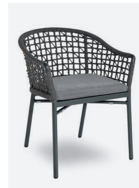
POLTRONCINA KARIN NET COD 723/AT