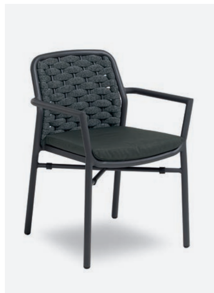
POLTRONCINA FLORA COD 717/AT35