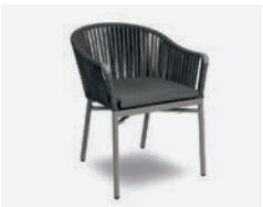
pag 74 KARIN POLTRONCINA / DINING ARMCHAIR cod 726/GR R60 h58 h78 h48 P47 X6