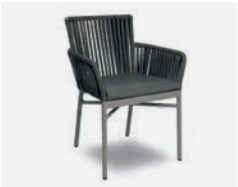
pag 72 MEGAN POLTRONCINA / DINING ARMCHAIR cod 728/GR R59 h59,5 h80 h47,5 P47 X6