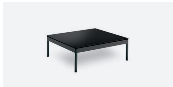
TAVOLINO BERGEN COD 545/AT