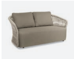
pag 14 METHOD DIVANO / 2 SEATER SOFA cod 566/BCO02 R172 h89.5 h74 h40