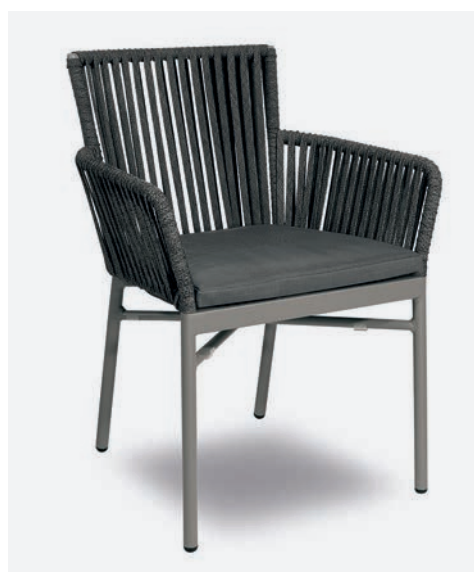
POLTRONCINA MEGAN COD 728/GR