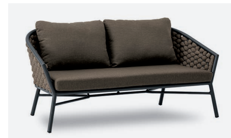
DIVANO DUB COD 501/AT04