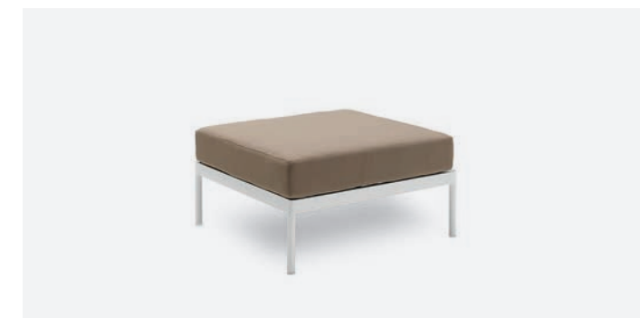
BASE SINGOLA VILLA COD 530/BCO