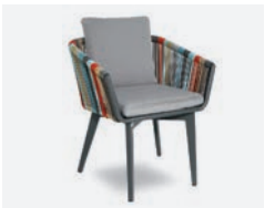
pag 62 IRIDE POLTRONCINA / DINING ARMCHAIR cod 721 R60 h59 h77 h47 P44