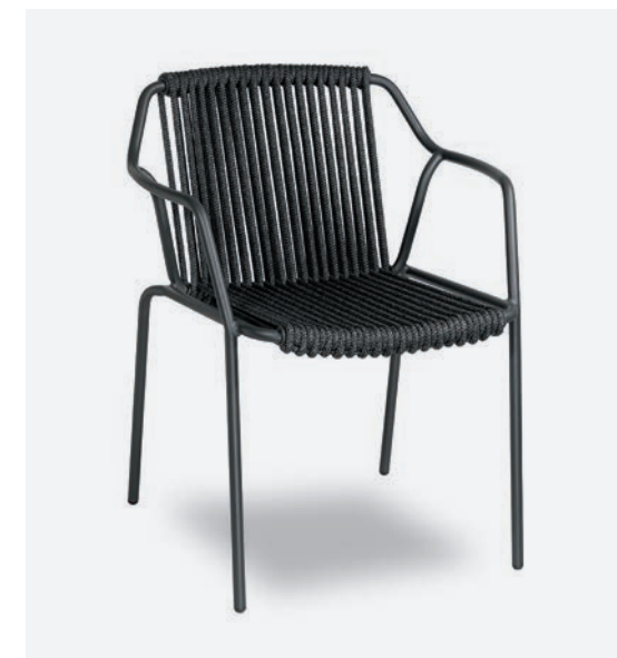
SEDIA EASY COD 773/AT34