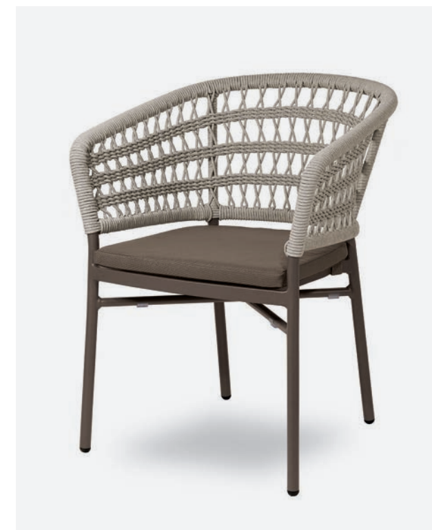
POLTRONCINA BLED COD 722/TAU