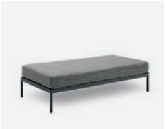
pag 92 VILLA BASE DOPPIA / DOUBLE BASE cod 531/AT ▮150 ▮75 ▮40