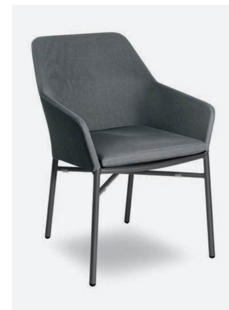
POLTRONCINA GISELLE COD 729/AT