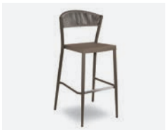
pag 120 DUKE SGABELLO / BARSTOOL cod 658/TAU ▮54 h 58 h113 h80 ▮41 ▮x6