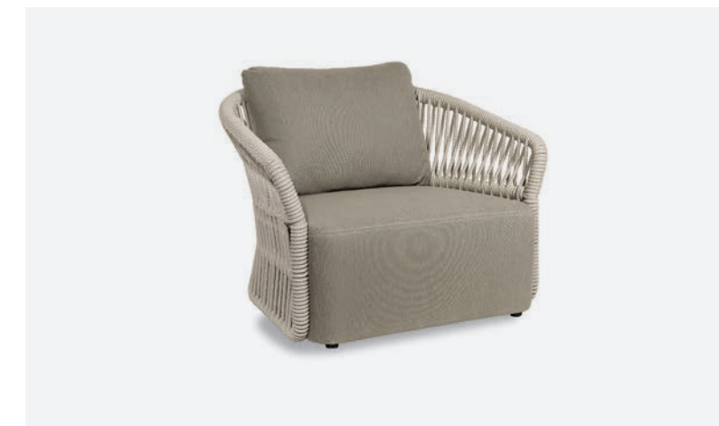
POLTRONA METHOD COD 565/BCO02