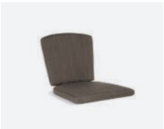
pag 76 KARIN - MEGAN CUSCINO / CUSHION cod 1530/04