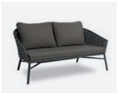
pag 40 DUB DIVANO / 2 SEATER SOFA cod 501/AT35 R161 h81 h74 h41