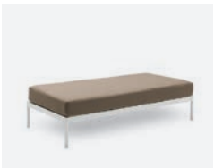
pag 94 VILLA BASE DOPPIA / DOUBLE BASE cod 531/BCO ▮150 ▮75 ▮40