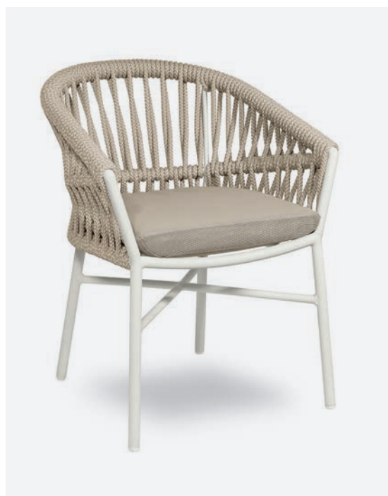
POLTRONCINA METHOD COD 715/BC002