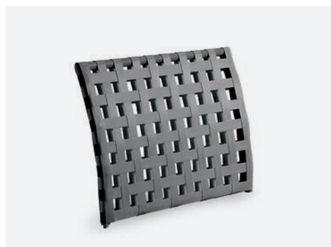
SCHIENALE VILLA COD 532/AT