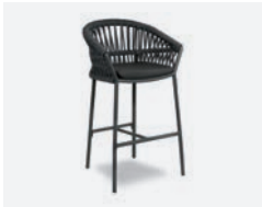
pag 22 METHOD SGABELLO / BARSTOOL cod 660/AT34 R60 h55 h105 h76 h42.5