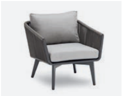
pag 58 DIVA POLTRONA / LOUNGE ARMCHAIR cod 505 R79 h80 h70 h42