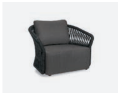
pag 10 METHOD POLTRONA / LOUNGE ARMCHAIR cod 565/AT34 R103 h89.5 h74 h40