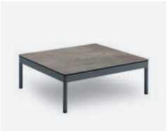
pag 70 BERGEN TAVOLINO / COFFEE TABLE cod 547/AT-FOS P75 P75 P28