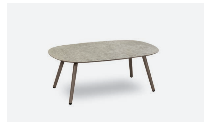
TAVOLINO DOVER COD 523/TAU-EMP