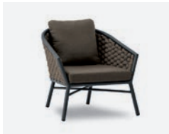
pag 36 DUB POLTRONA / LOUNGE ARMCHAIR cod 500/AT04 R80 h81 h74 h41