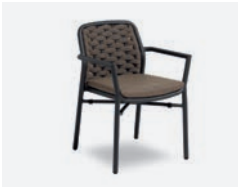
pag 110 FLORA POLTRONCINA / DINING ARMCHAIR cod 717/AT04 ▮55,5 h 56 h78 h145 ▮45 ▮x8