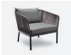
pag 70 BERGEN POLTRONA / LOUNGE ARMCHAIR cod 542/AT R86 h85 h80 h41