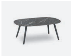
pag 10 DOVER TAVOLINO / COFFEE TABLE cod 523/AT-MAGR n95 n59 n36