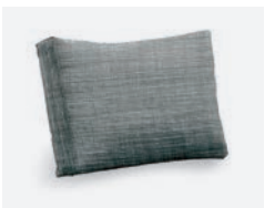
pag 92 VILLA CUSCINO SCHIENALE / BACKREST CUSHION cod 533/GR ▮73 ▮45