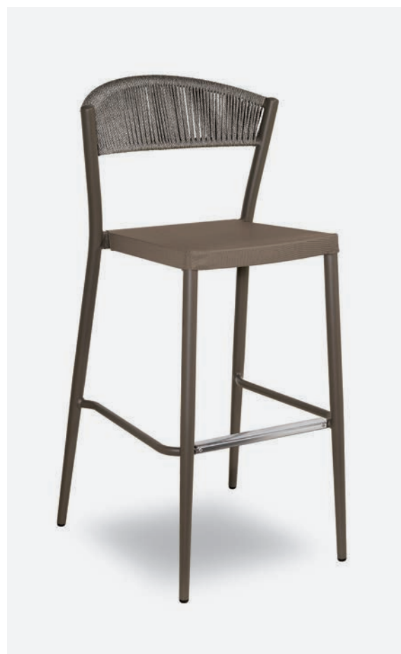
SGABELLO DUKE COD 658/TAU