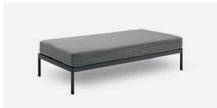
BASE DOPPIA VILLA COD 531/AT