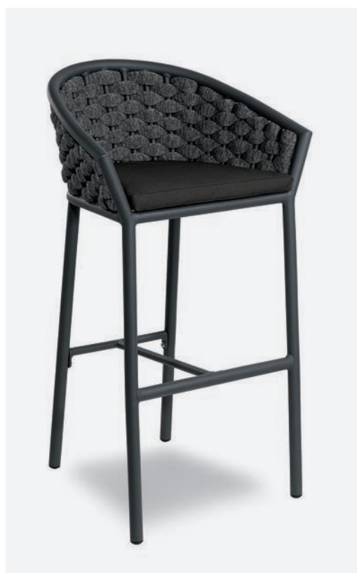
SGABELLO DUB COD 655/AT35

Barstool with polyester powder coated aluminum frame. Back is covered with a hand-woven synthetic fabric tubular padded with rubber. The cushion has a removable PVC fabric cover and quick dry padding.