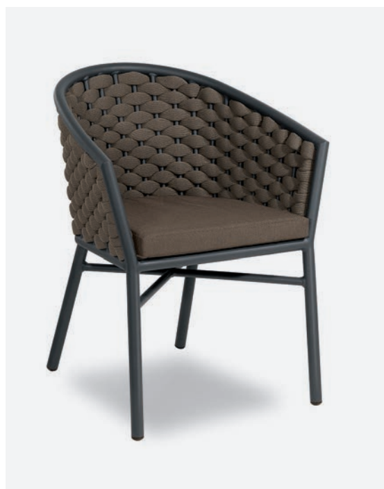
POLTRONCINA DUB COD 718/AT04