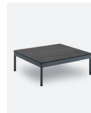
TAVOLINO BERGEN COD 547/AT-ARDE