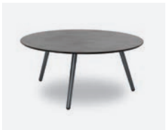
pag 86 PRAGA TAVOLINO / COFFEE TABLE cod 548/AT-CEM P69 P36