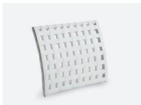
SCHIENALE VILLA COD 532/BCO