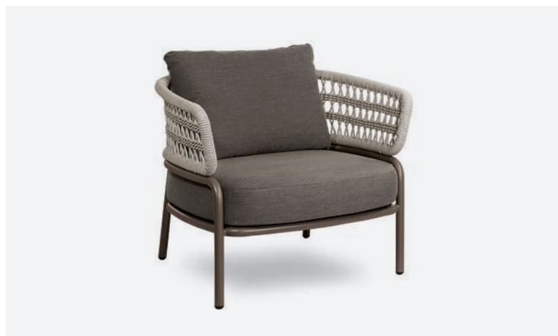
POLTRONA BLED COD 527/TAU