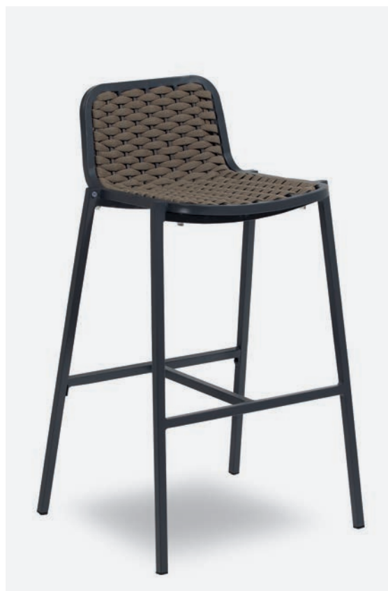
SGABELLO ALEX COD 651/AT04

Barstool with polyester powder coated aluminum frame. Back and seat are covered with a hand-woven synthetic fabric tubular padded with rubber.