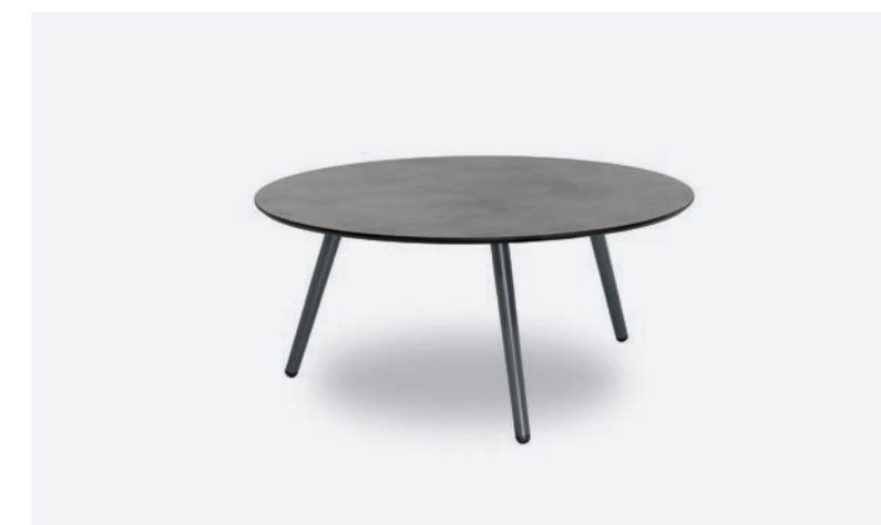
TAVOLINO PRAGA COD 548/AT-CEM