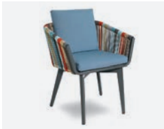
pag 62 IRIDE FODERA CUSCINO / CUSHION COVER cod 1721/33