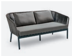
pag 70 BERGEN DIVANO 2 POSTI / 2 SEATER SOFA cod 543/AT R168 h85 h80 h41