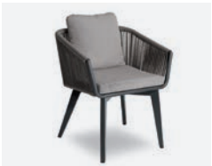
pag 60 LADY POLTRONCINA / DINING ARMCHAIR cod 720 R60 h59 h77 h47 P44