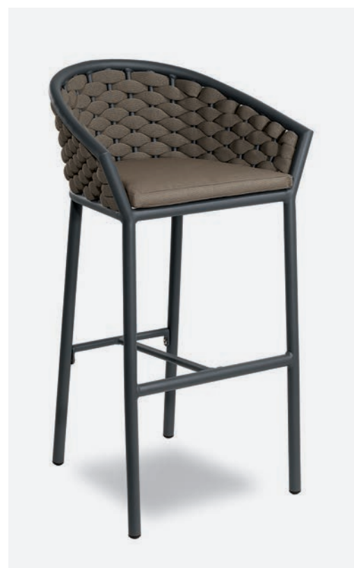
SGABELLO DUB COD 655/AT04