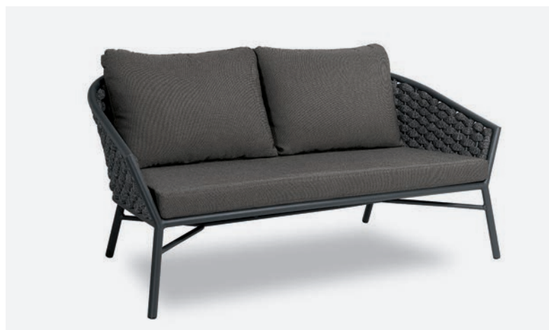
DIVANO DUB COD 501/AT35