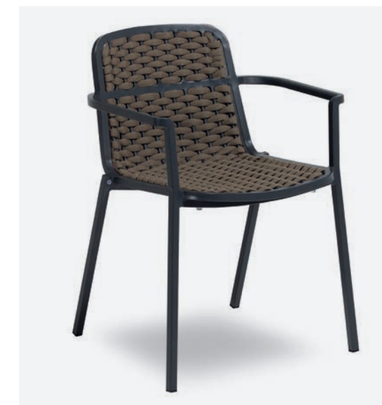
POLTRONCINA ALESSIA COD 774/AT04

Dining armchair with polyester powder coated aluminum frame. Back and seat are covered with a hand-woven synthetic fabric tubular padded with rubber.