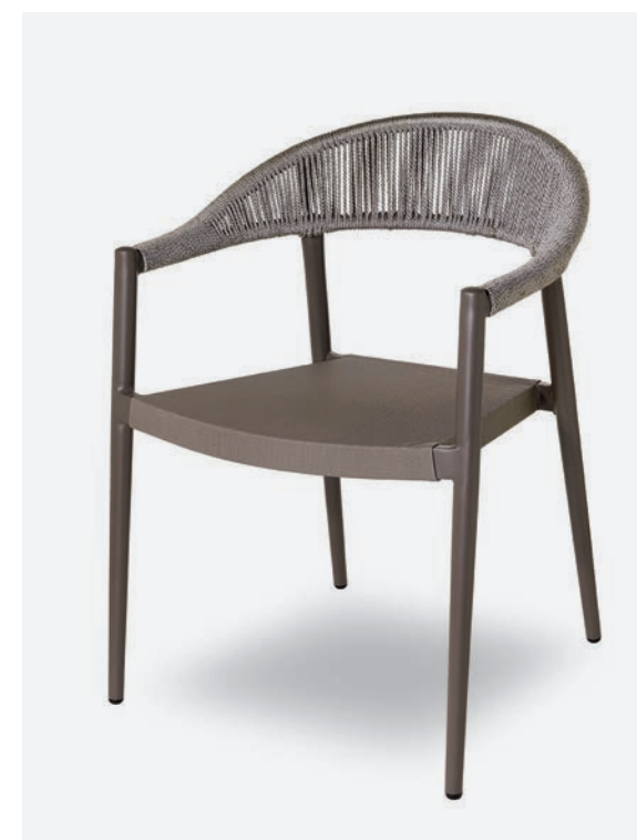
POLTRONCINA PRAGA COD 793/TAU