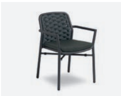
pag 110 FLORA POLTRONCINA / DINING ARMCHAIR cod 717/AT35 ▮55,5 h 56 h78 h145 ▮45 ▮x8