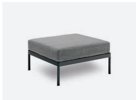
BASE SINGOLA VILLA COD 530/AT