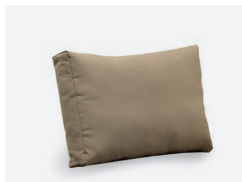
CUSCINO SCHIENALE VILLA COD 533/TAU

I cuscini sono in tessuto 100% poliestere e sfoderabili. Il tavolino è in alluminio verniciato a polveri di poliestere con piano in vetro temperato.