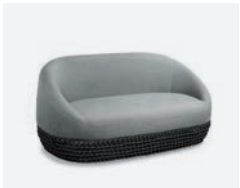
pag 86 TONGA DIVANO / SOFA cod 561/AT R180 h91 h72 h41