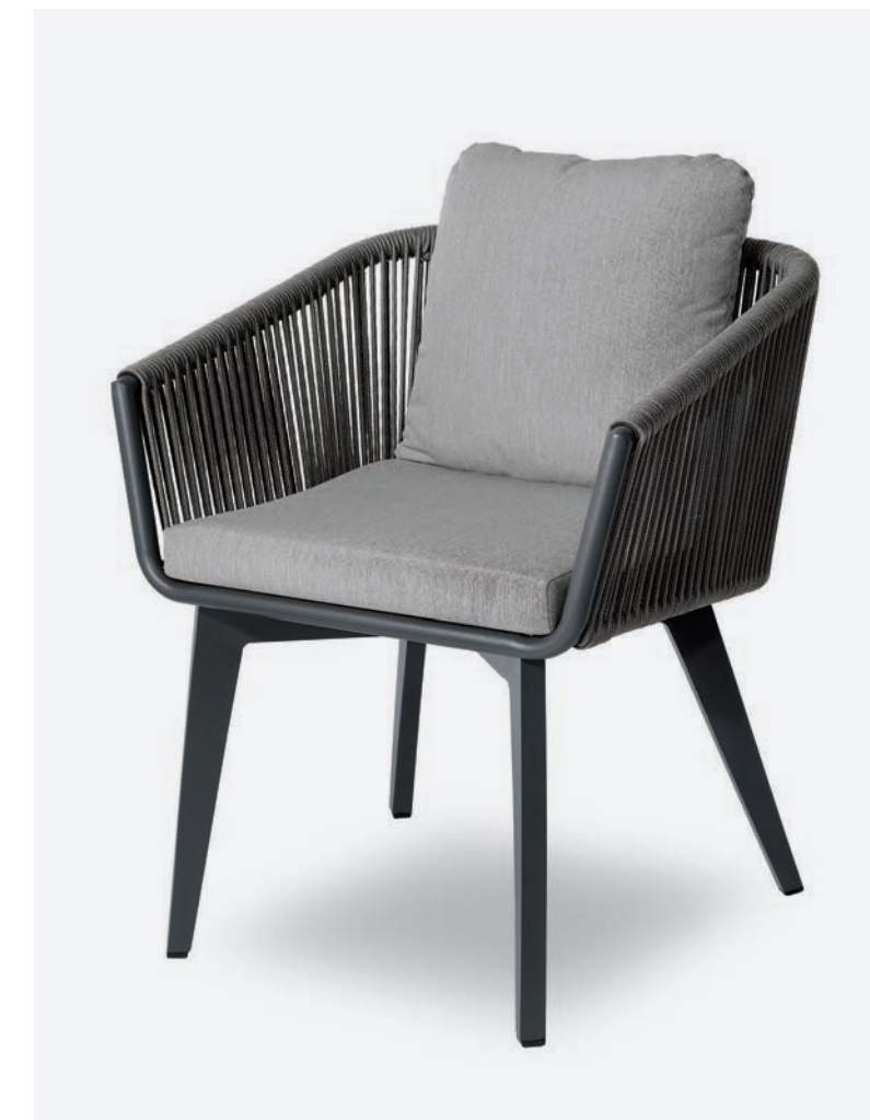
POLTRONCINA LADY COD 720

Dining armchair with polyester powder coated aluminum frame. Back is covered with a hand-woven synthetic rope. The cushion has a removable 100% polyester fabric cover.