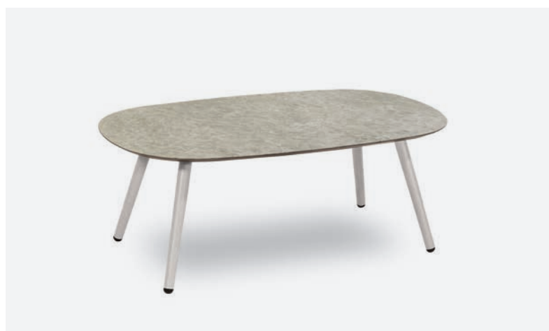
TAVOLINO DOVER COD 523/BCO-EMP