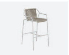
pag 100 EASY SGABELLO / BARSTOOL cod 662/BCO02 ▮60 h 55 h105 h176 ▮42.5