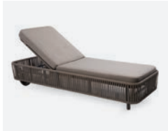
pag 80 BERGEN LETTINO / SUNLOUNGER cod 604/AT P75 P210 P34