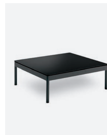
TAVOLINO BERGEN COD 545/AT

The coffee table is in polyester powder coated aluminum with tempered glass or 12mm HPL-Compact top.