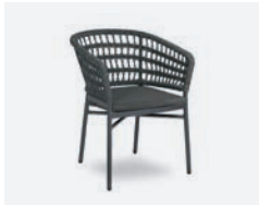
pag 32 BLED POLTRONCINA / DINING ARMCHAIR cod 722/AT R63 h63 h81 h48 h45 x8