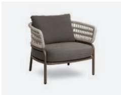
pag 28 BLED POLTRONA / LOUNGE ARMCHAIR cod 527/TAU R92 h83 h76 h43