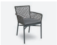
pag 124 MEGAN NET POLTRONCINA / DINING ARMCHAIR cod 724/AT ▮59 h 61 h80 h147,5 ▮47 ▮x6