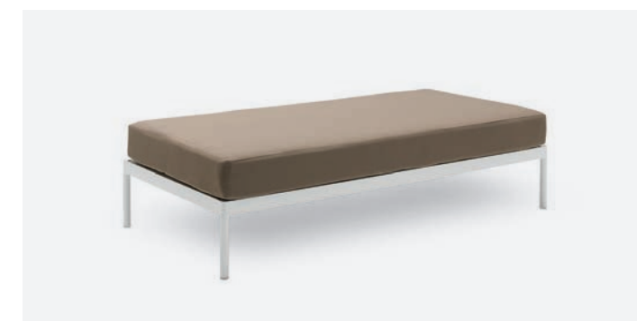
BASE DOPPIA VILLA COD 531/BCO