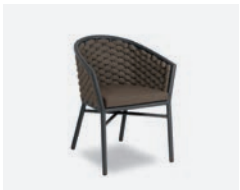
pag 50 DUB POLTRONCINA / DINING ARMCHAIR cod 718/AT04 R60 h60 h77 h47 h48 x5