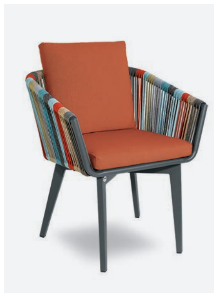
FODERA OPZIONALE COL. MATTONE COD 1721/07