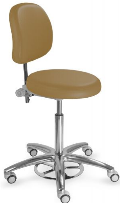
Ilustrační foto (1255 G clean):