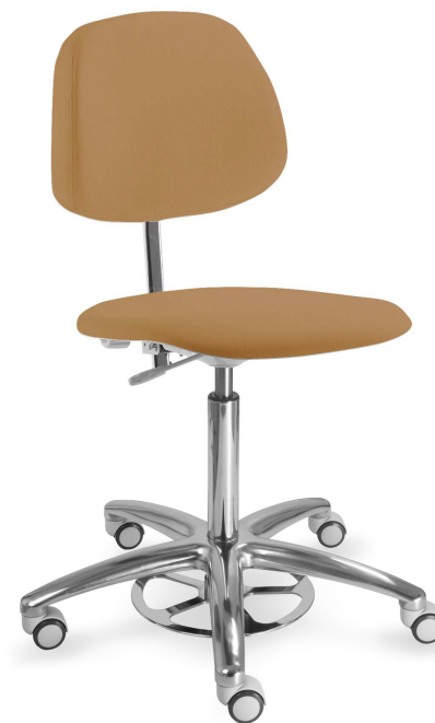
Ilustrační foto (2205 G clean):