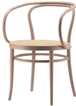
209 ROHRGEFLECHT/ CANEWORK