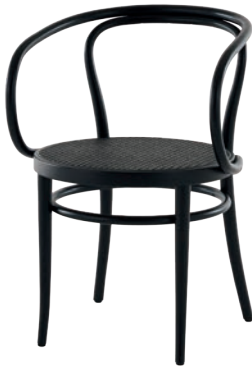
209 ROHRGEFLECHT/ CANEWORK DARK MELANGE