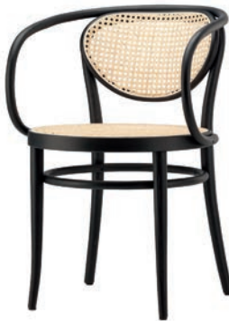
210 R SITZ UND RÜCKEN ROHRGEFLECHT/ CANEWORK SEAT AND BACKREST