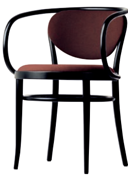
210 P SITZ UND RÜCKEN SPIEGELPOLSTERUNG/ MOULDED PLYWOOD SEAT AND BACKREST