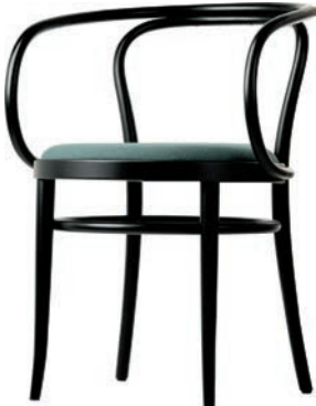
209 P SITZ MIT SPIEGELPOLSTERUNG/ SEAT UPHOLSTERED