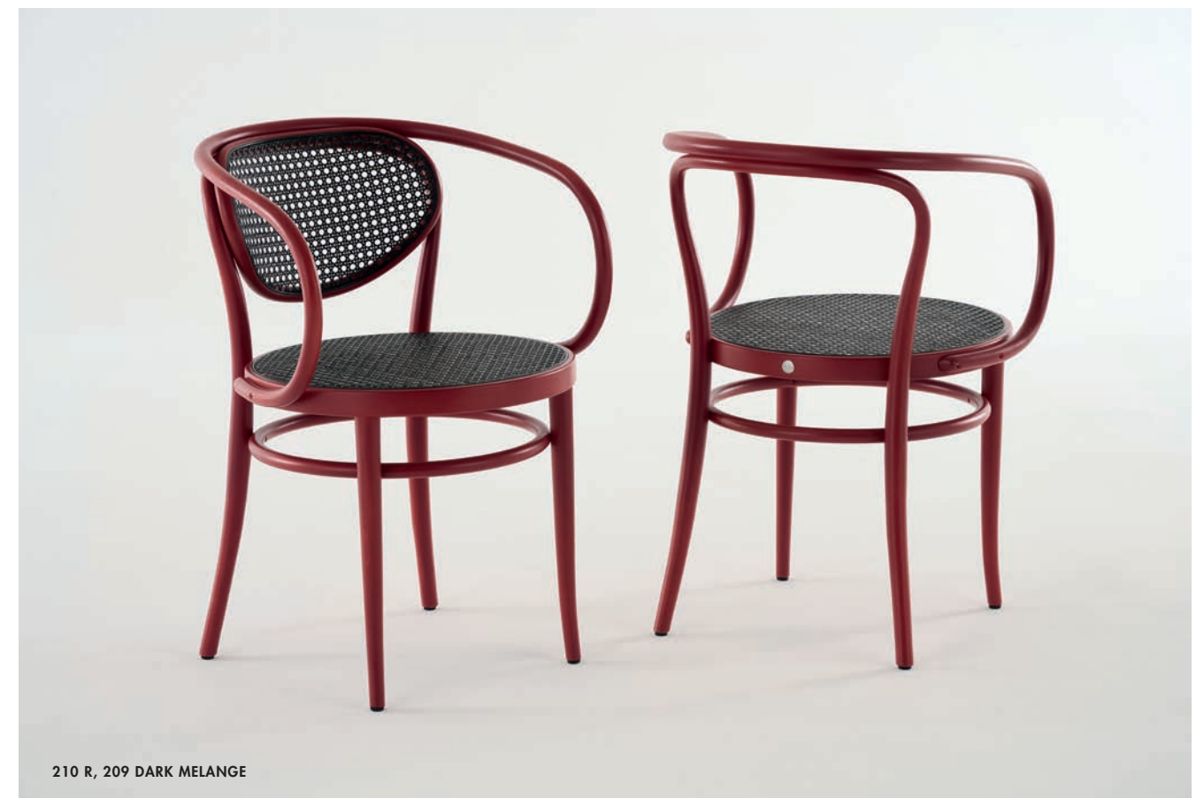
210 R, 209 DARK MELANGE

EN This elegant bentwood classic is a masterpiece in its construction and production: the projecting frame that forms both the backrest and armrest is bent into its form from a single piece of solid beech wood. Like the original model of all bentwood chairs, no. 214, chair no. 209 also consists of only six parts. Due to its aesthetic reduction in combination with the organic form, it almost looks like a sculpture. Swiss architect Le Corbusier was fascinated with it and used it in many of his buildings, for example the Weissenhof Estate in Stuttgart in 1927. He once remarked that this chair “possesses nobility.”