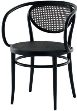
210 R SITZ UND RÜCKEN ROHRGEFLECHT/ CANEWORK SEAT AND BACKREST DARK MELANGE