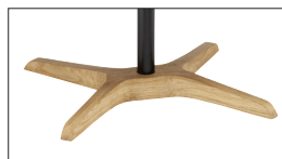
Holz mit Bugholzteilen: Eiche Wood with bent parts: oak