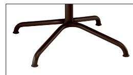
Stahlrohr verchromt oder lackiert Tubular steel chrome-plated or lacquered