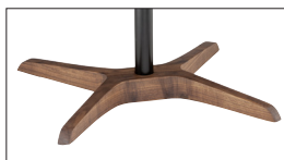
Holz mit Bugholzteilen: Nussbaum, Eiche Wood with bent parts: walnut