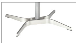
Edelstahl Stainless steel