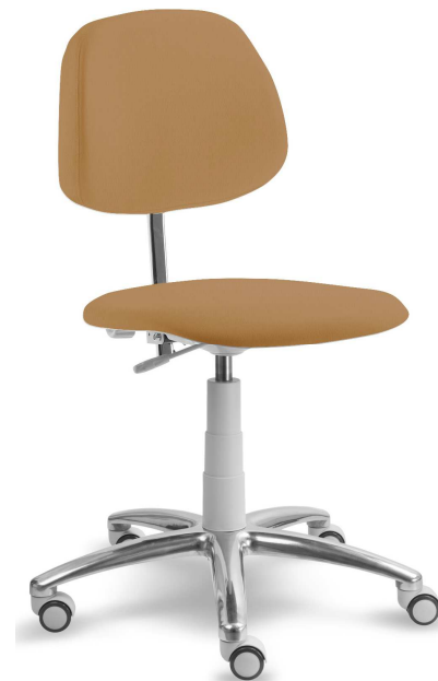
Ilustrační foto (2205 G):