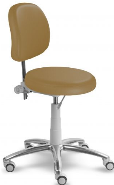
Ilustrační foto (1255 G):