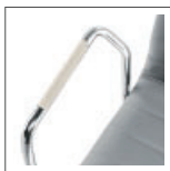
CM/71 crema cream crème