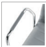
GR/19 grigio grey gris