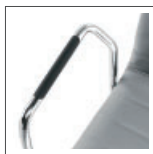
NE/09 nero black noir