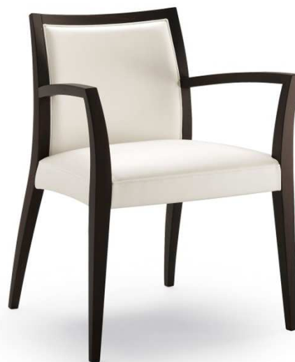
Dimensioni / Sizes (cm) A

Dynamic seating. By crossing different surfaces and volumes, this model was created, inspired by the dual idea of visual movement and soft relaxation, thanks to the ergonomic lines of the chunky upholstered seat. Also available in stackable chair and armchair with upholstered sides versions.