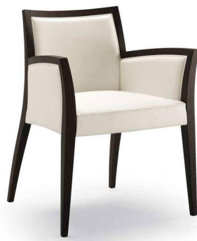
Dimensioni / Sizes (cm) A

Dynamic seating. By crossing different surfaces and volumes, this model was created, inspired by the dual idea of visual movement and soft relaxation, thanks to the ergonomic lines of the chunky upholstered seat. Also available in stackable chair and armchair with open sides version.