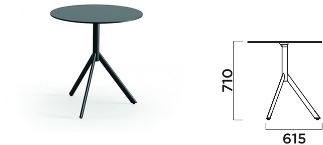
TABLE TOP SIZES (mm) DIMENSIONI PIANI TAVOLO (mm). TAMAÑOS DE TABLEROS DE MESA (mm)