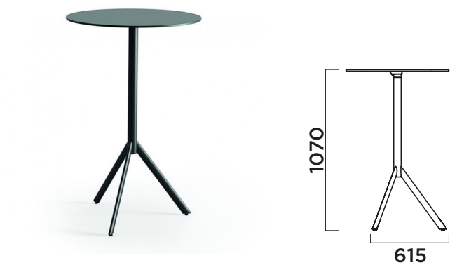
TABLE TOP SIZES (mm) DIMENSIONI PIANI TAVOLO (mm). TAMAÑOS DE TABLEROS DE MESA (mm)