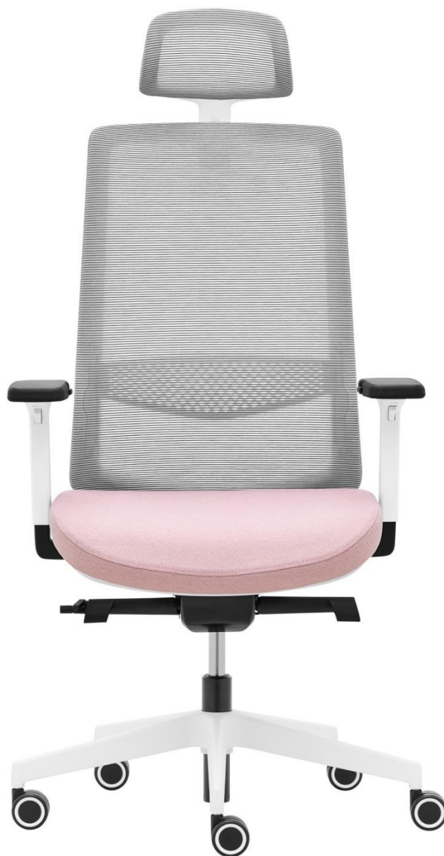
VICTORY VI 1401