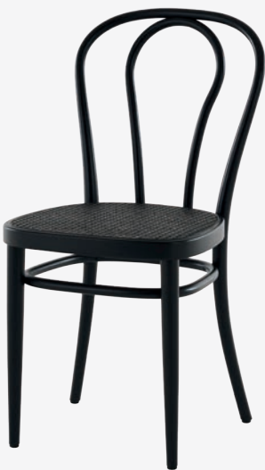
218 ROHRGEFLECHT DARK MELANGE/ CANEWORK DARK MELANGE