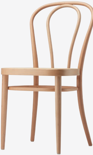
218 M MULDENSITZ/MOULDED PLYWOOD SEAT