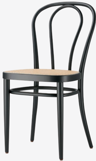
218 ROHRGEFLECHT/ CANEWORK