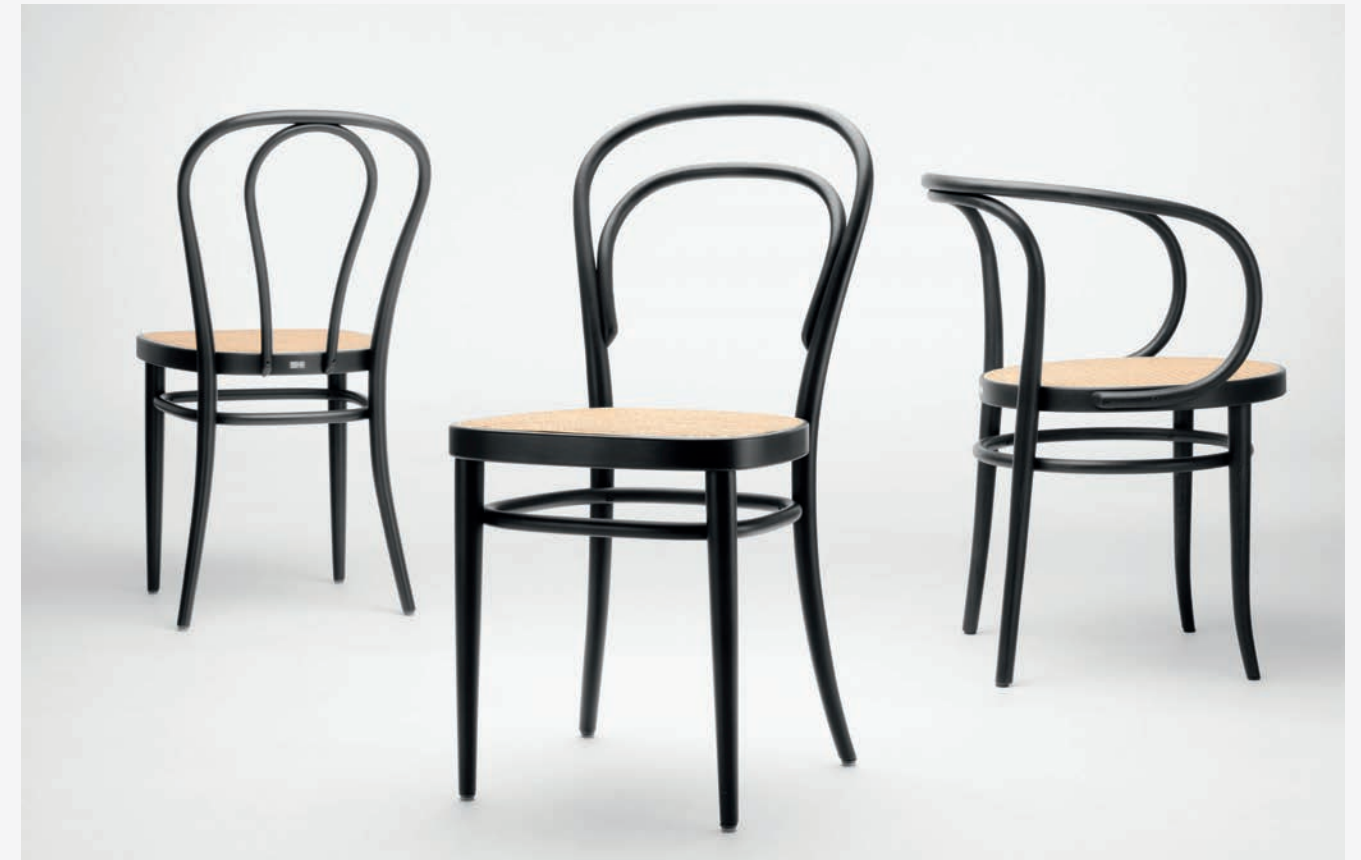
218, 214 UND/AND 209 BUCHE GEBEIZT TP 29, ROHRGEFLECHT MIT KUNSTSTOFFSTÜTZGEWEBE/ BEECH STAINED TP 29, CANEWORK WITH SYNTHETIC MESH

EN First manufactured in 1876, model no. 18 with the striking “hairpin” in its backrest returns to the Thonet portfolio with clear and reduced aesthetics as 218. Along with the chairs no. 14 and no. 56, chair no. 18 was one of the bestselling models of the Thonet production. Known as the “export chair” of Gebrüder Thonet, it was often sold for use in restaurants and cafés – especially in South America. Disassembled into its individual parts, 36 chairs fit into a sea chest, allowing large quantities of the chairs to be easily sent on long journeys. No. 18 – now with the model no. 218 – is once again being produced in Frankenberg.