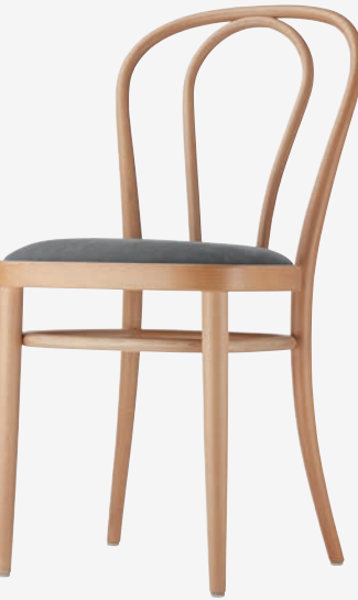
218 P GEPOLSTERT/UPHOLSTERED