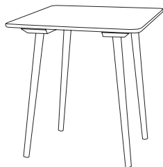
4BG 134 4F1 134