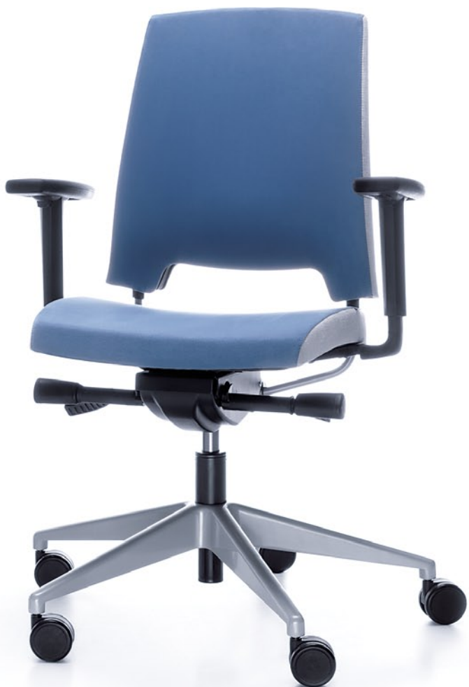
ARCA 21SL METALIK P54PU