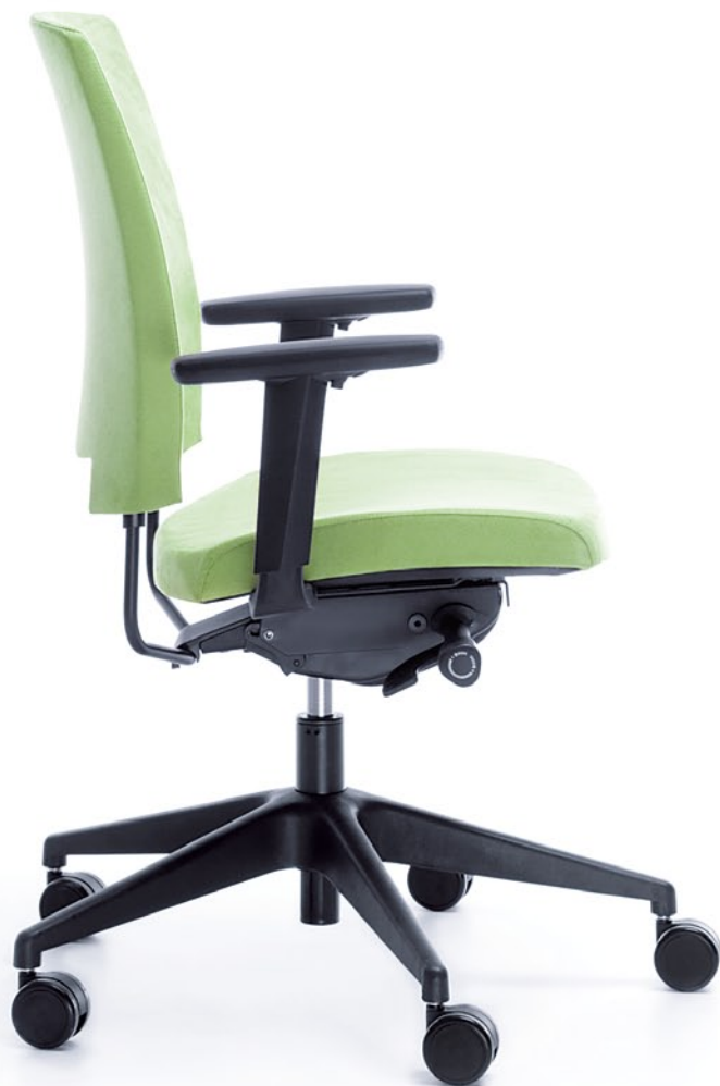
ARCA 21SL CZARNY P54PU