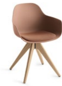
Pola Round P/WP