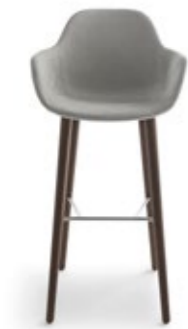
Pola Round 65-73-82/4W