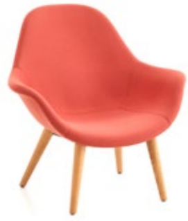
Pola Lounge LP/4W