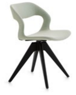
Mixis Air R/WP