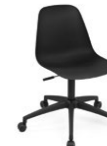
Pola Light R/SW