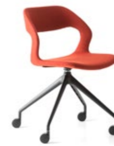
Mixis Air R/PB1