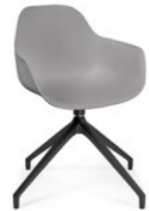
Pola Round P/PB