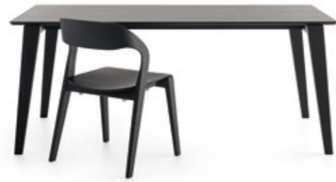
Mixis T Dining