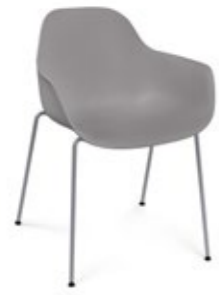
Pola Round P/4L