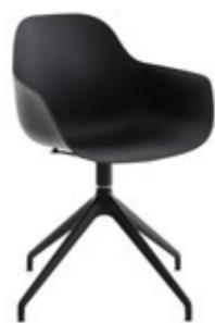
Pola Round P/PB1