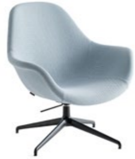
Pola Lounge LP/PB3