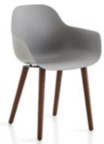
Pola Round P/4W