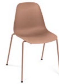
Pola Light R/4L