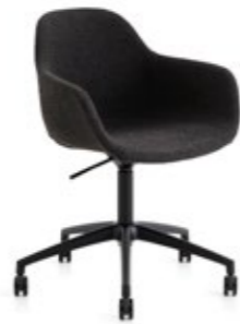
Pola Round P/SW