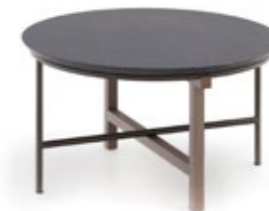
Mimico Caffè Table