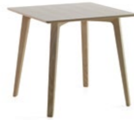
Mixis T Contract