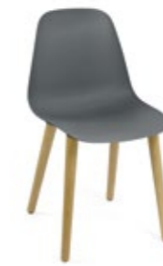
Pola Light R/4W