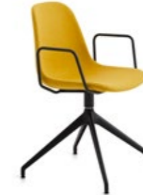
Pola Light P/PB1