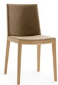
Bianca Light R