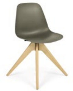
Pola Light R/WP