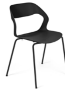
Mixis Air R/4L