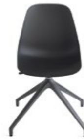
Pola Light P/PB