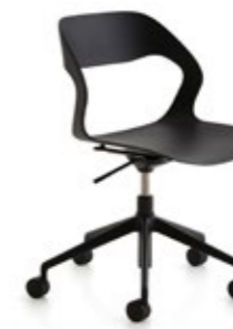
Mixis Air R/SW