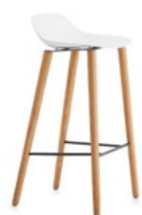
Pola Low 65-73-82/4W