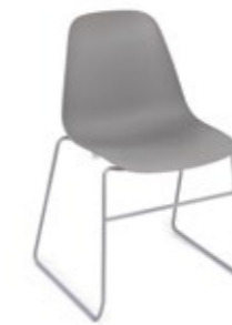
Pola Light R/SB