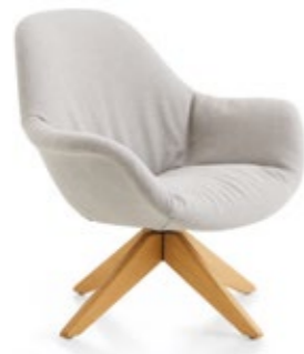
Pola Lounge LP/WP