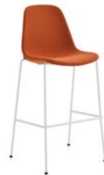
Pola Light 65-73-82/4L