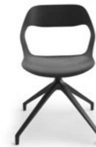
Mixis Air R/PB