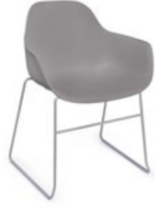
Pola Round P/SB