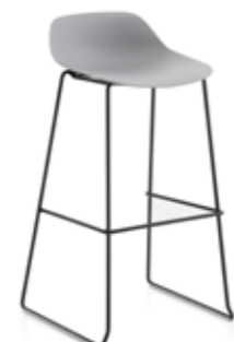
Pola Low 65-73-82/SB