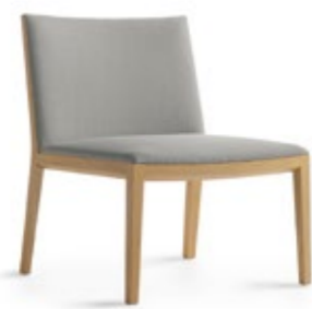
Bianca Light XXL