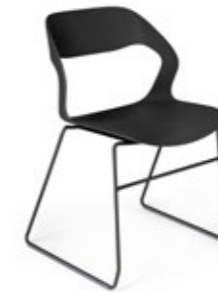
Mixis Air R/SB