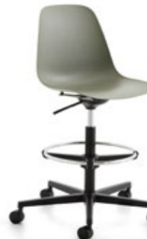
Pola Light HA/SW