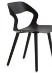
Mixis Air R/4W