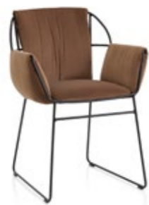
Emma Soft P