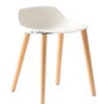
Pola Low R/4W