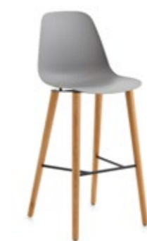
Pola Light 65-73-82/4W