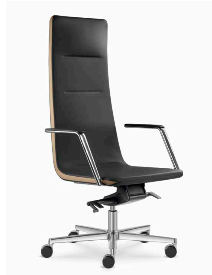
820-H ■ + BR-821