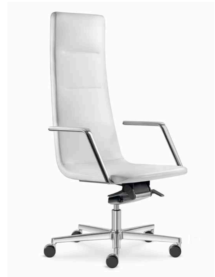
820-H ■ + BR-821