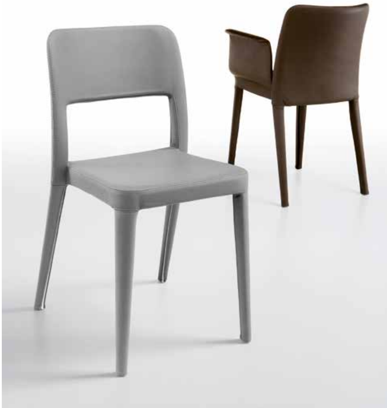
.07 NENÉ SR CF ecopelle 718, NENÉ PR SF ecopelle 714. NENÉ SR CF ecoleather 718, NENÉ PR SF ecoleather 714.