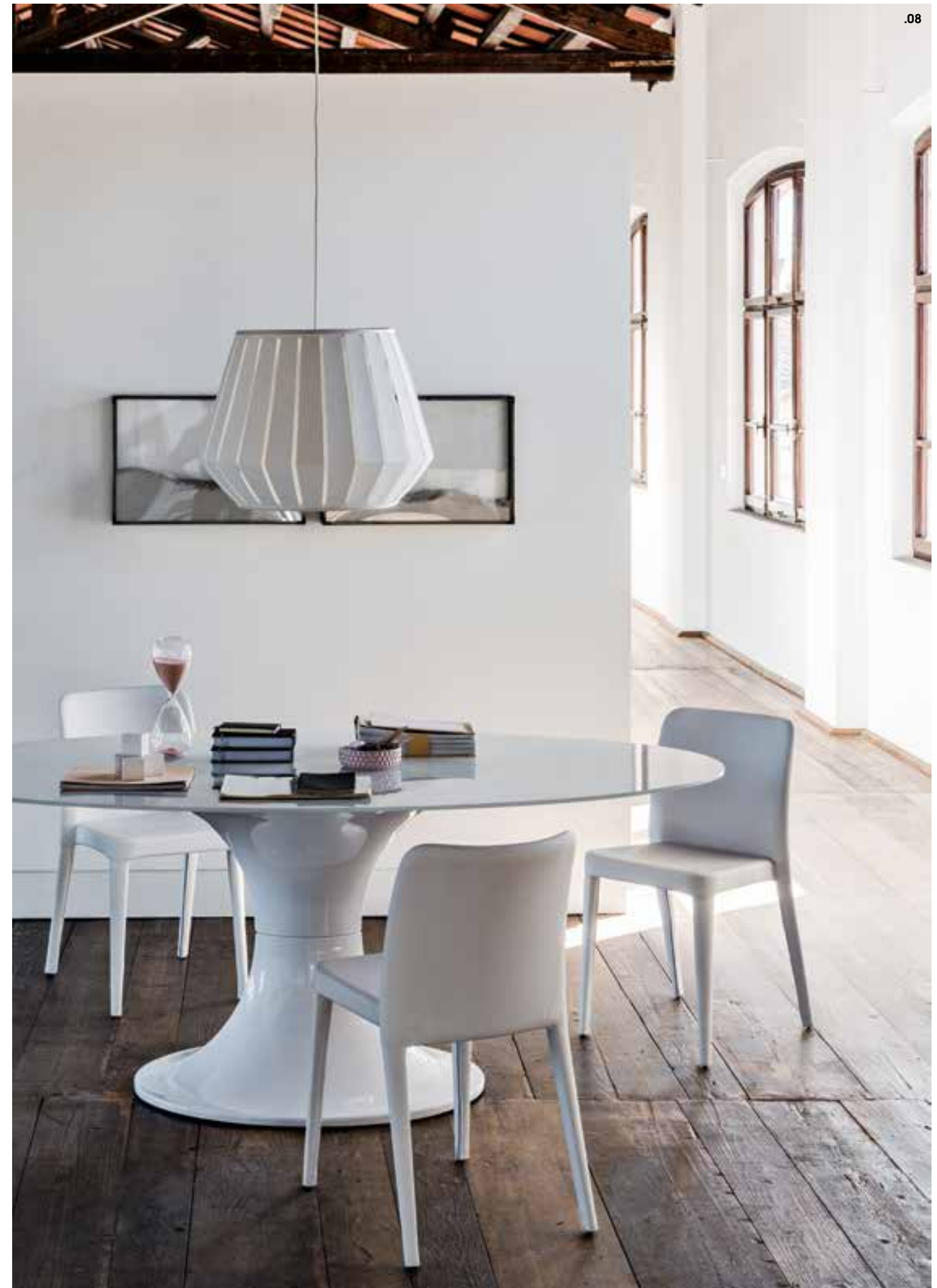
.08 NENÉ SR SF ecopelle 722, LONDON tavolo fisso 2000x1100, piano VE5. NENÉ SR SF ecoleather 722, LONDON fix table 2000x1100, top VE5.