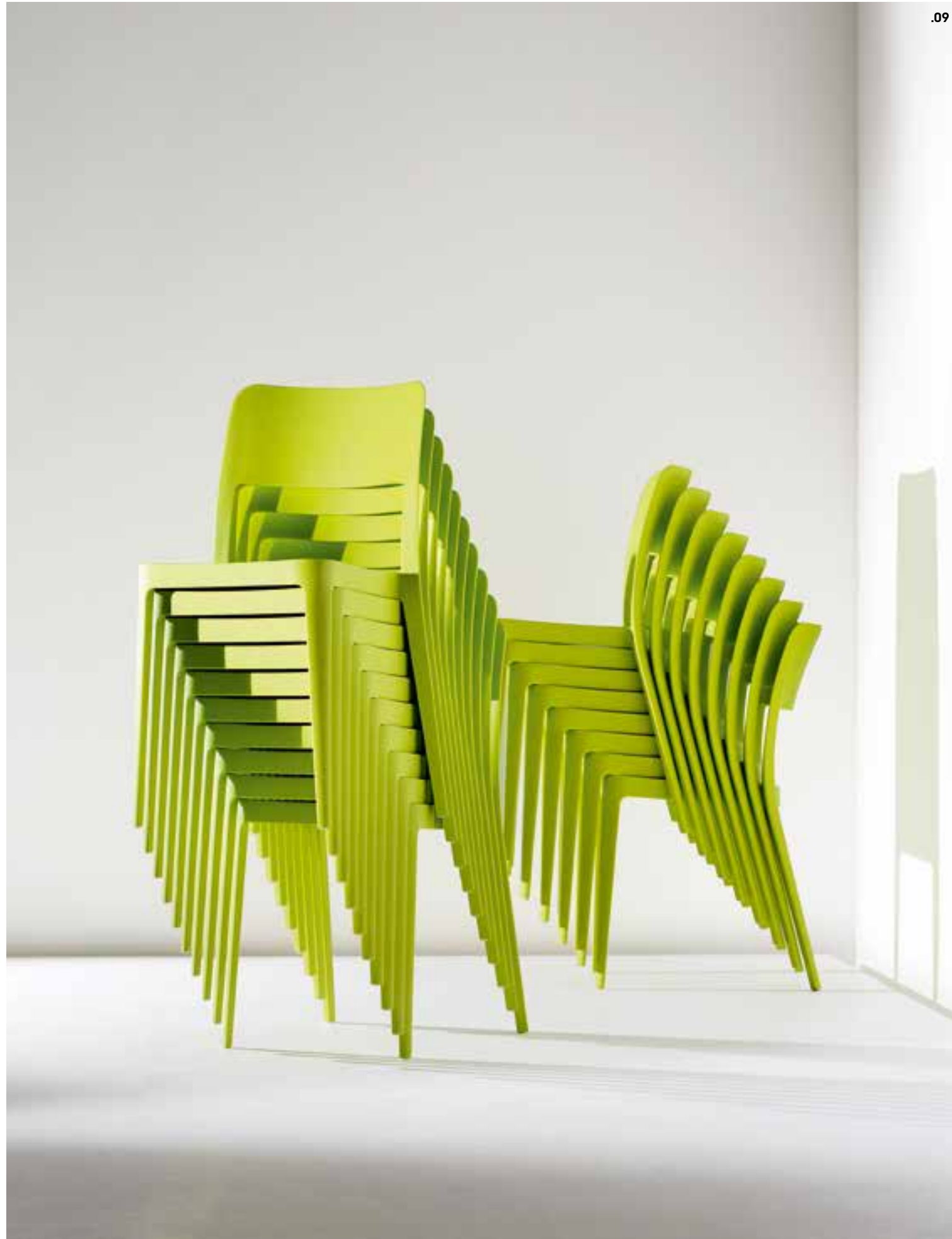
.09 NENÈ S polipropilene P18. NENÈ S polypropylene P18.