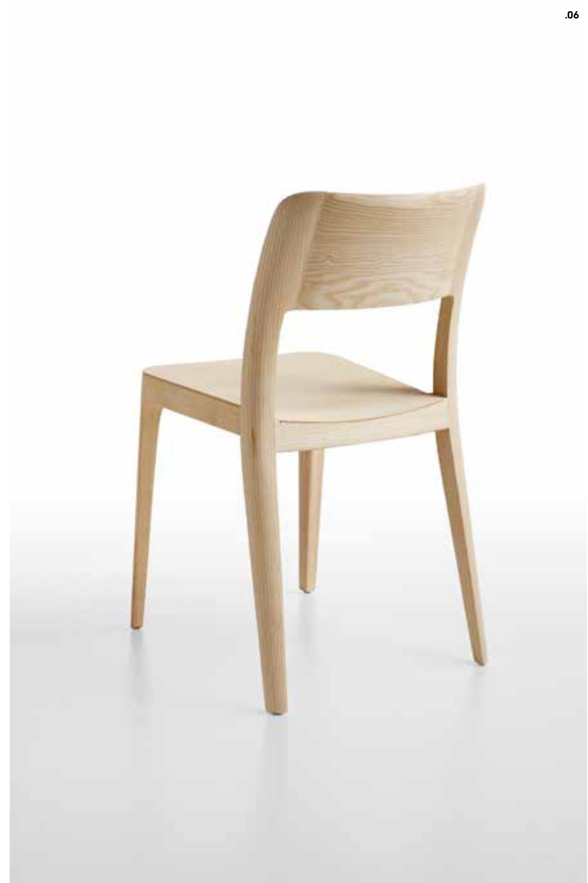
.05 NENÈ L legno L26, ARMANDO tavolo fisso acciaio D. NENÈ L wood L26, ARMANDO fix table steel D.