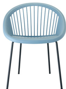
2684 VA 62