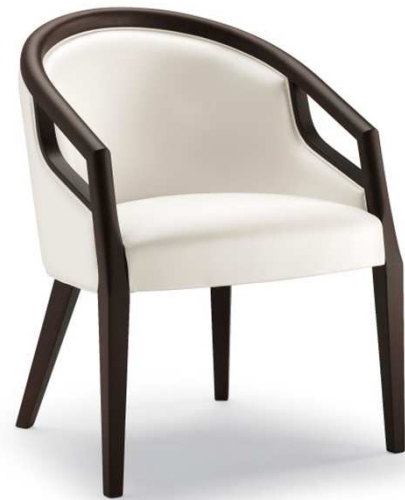
Dimensioni / Sizes (cm) A

A. Le dimensioni indicate rappresentano il massimo ingombro dell'oggetto. B. Il consumo di tessuto è valido per stoffa o ecopelle in tinta unita, rotoli di altezza 140 cm.